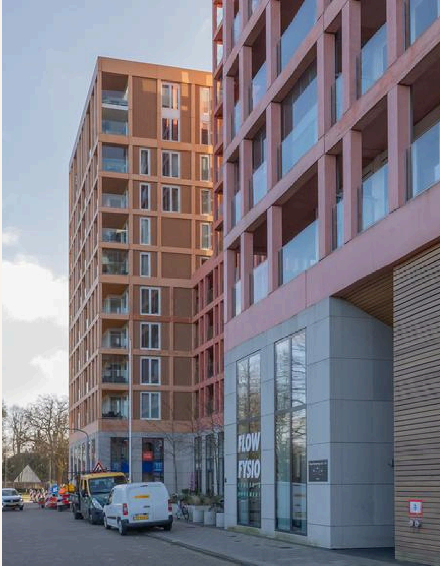
Claus Sluterweg 179, Haarlem