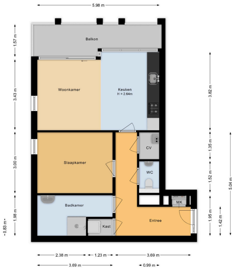
Claus Sluterweg 179 Haarlem 2e Verdieping

Deze plattegrond is met de grootst mogelijke zorg samengesteld. Desondanks kunnen er geen rechten aan worden ontleend en kunnen er kleine afwijking zijn in de exacte maatvoering. www.agvastgoedmedia.nl