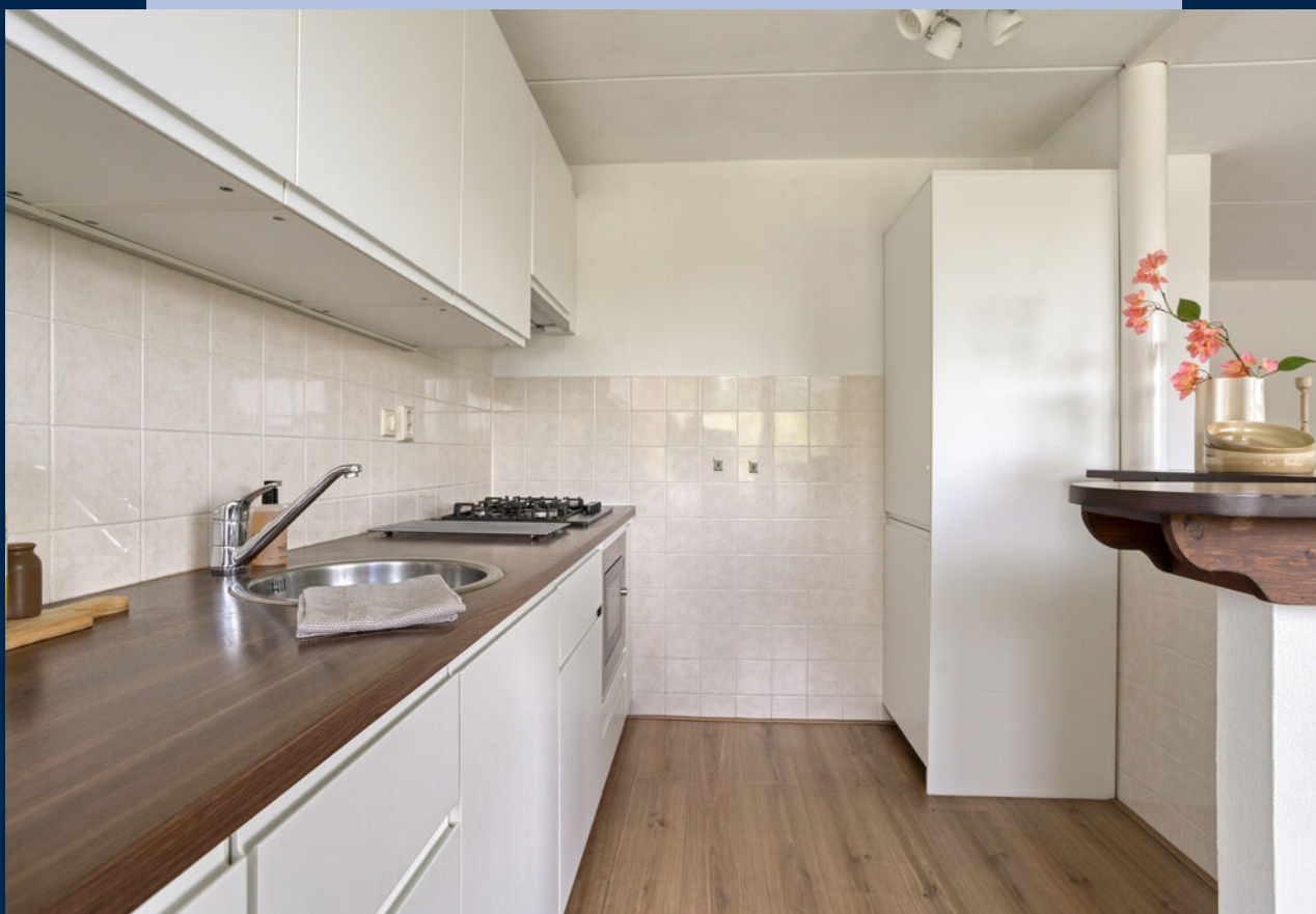
De half-open keuken met bar is praktisch ingedeeld en voorzien van diverse inbouwapparatuur, waaronder een recent vervangen combimagnetronoven (2023).