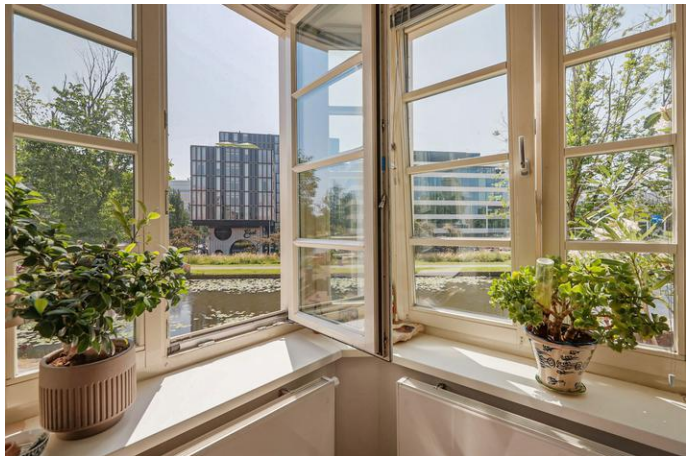
Transvaalkade 131 1, 1091 LT Amsterdam