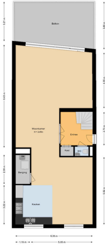
Egelantierlaan 45 Haarlem 1e Verdieping

Deze plattegrond is met de grootst mogelijke zorg samengesteld. Desondanks kunnen er geen rechten aan worden ontleend en kunnen er kleine afwijking zijn in de exacte maatvoering. www.agvastgoedmedia.nl