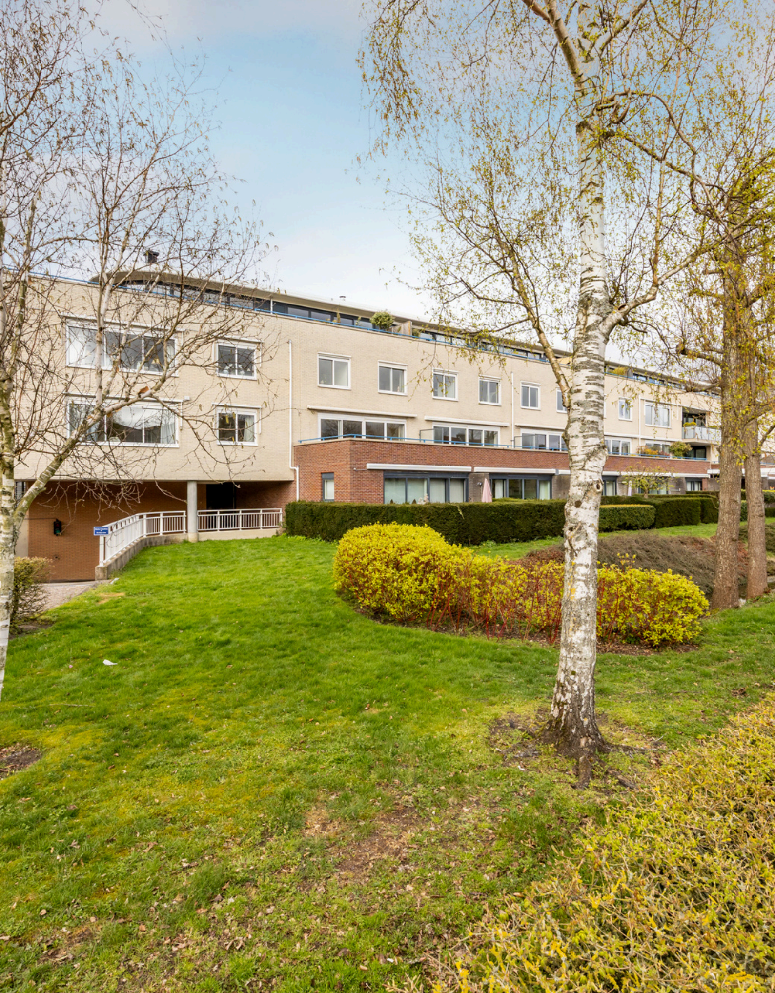
Egelantierlaan 45, Haarlem