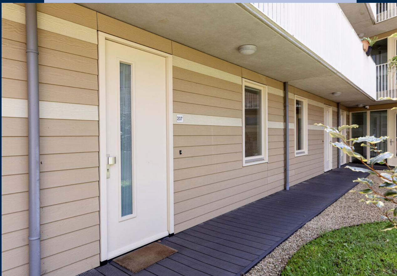
Op de eerste woonlaag bevindt zich een ruime en sfeervolle gezamenlijke binnentuin.