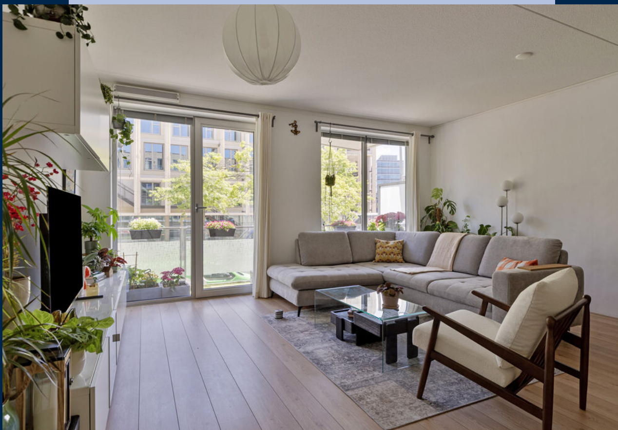
De lichte woonkamer heeft een balkon over de volledige breedte van het appartement.