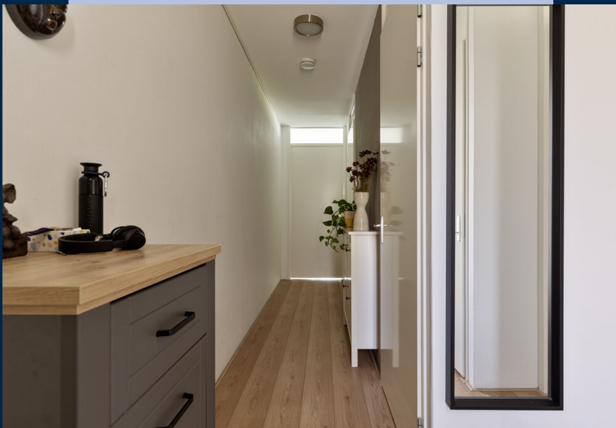
Bij binnenkomst in het appartement kom je in de hal met toegang tot de slaapkamer, de meterkast, een praktische berg-/wasruimte en de badkamer.