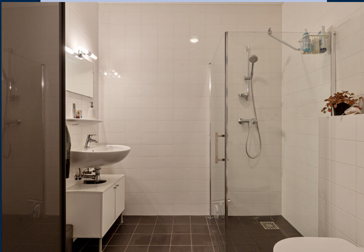
De badkamer is compleet uitgerust met een inloopdouche, wastafel en toilet.