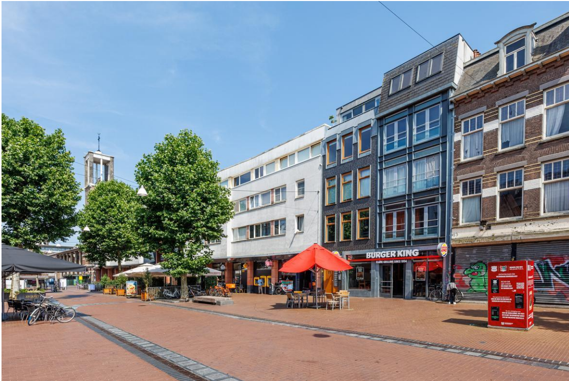
Molenstraat 49A - Nijmegen Derde Verdieping