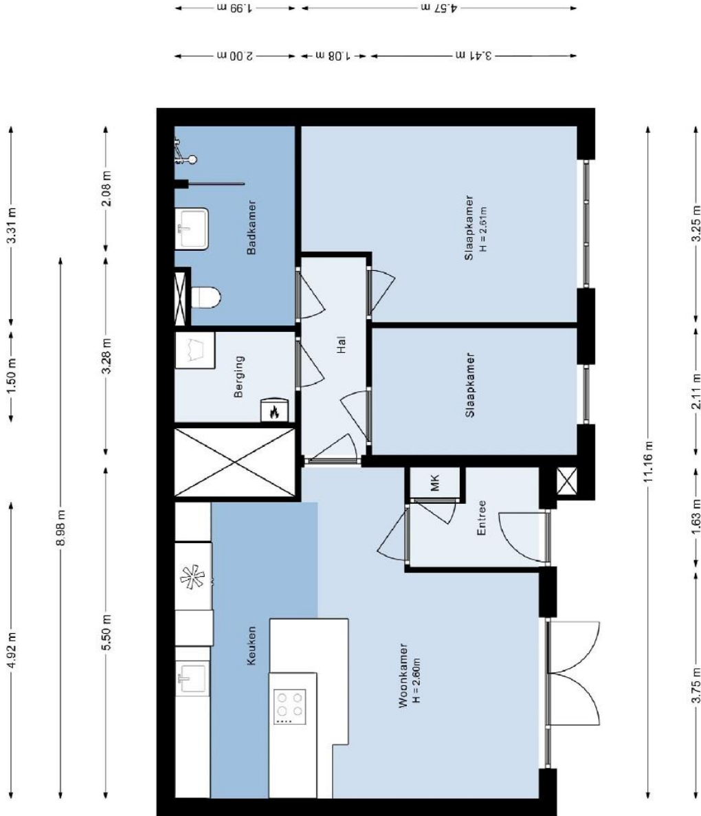
Appartement Meeroever 2 Hillegom