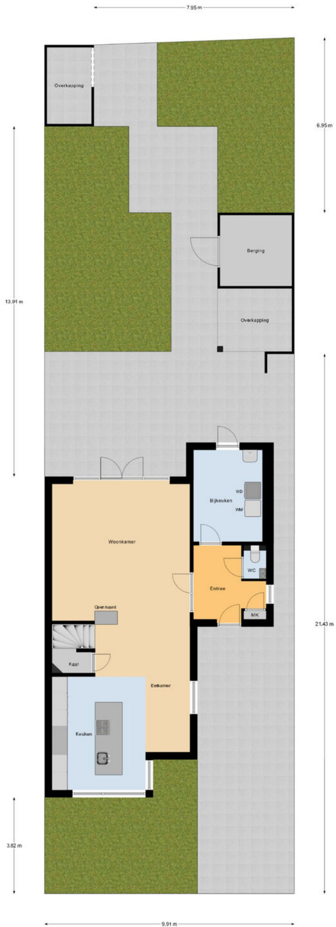
Begane Grond Tuin