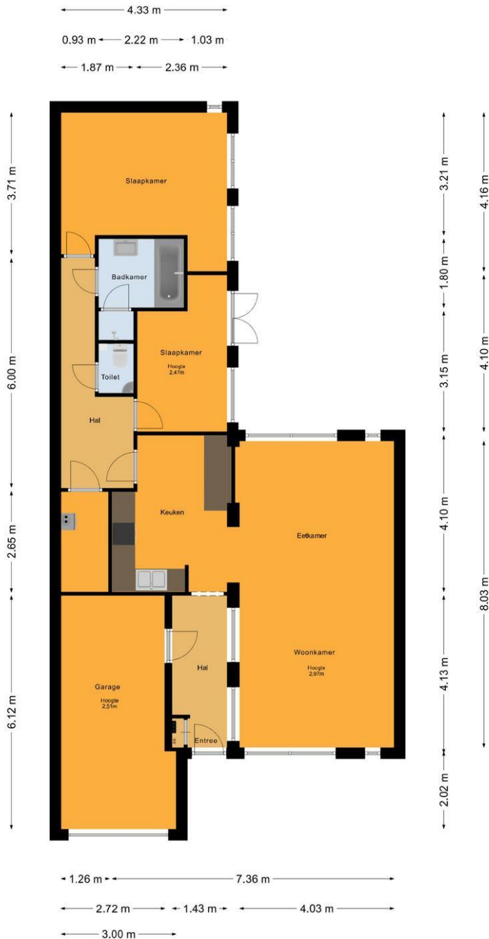
Violetstraat 13, Almere Begane Grond

De plattegronden zijn voor promotionele doeleinden en ter indicatie. Aan de plattegronden kunnen geen rechten worden ontleend. © het MeetLoket