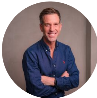
FRANK KARSSING SPECIALIST WONINGFOTOGRAFIE

035 - 60 17 962 hypotheeken@vanbreukelen.nu