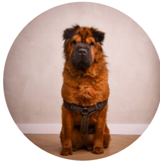
ABBY DE KANTOORHOND ADVISEUR IN ONTSPANNING

06 46 35 72 74 035 - 60 17 962 makelaardij@vanbreukelen.nu