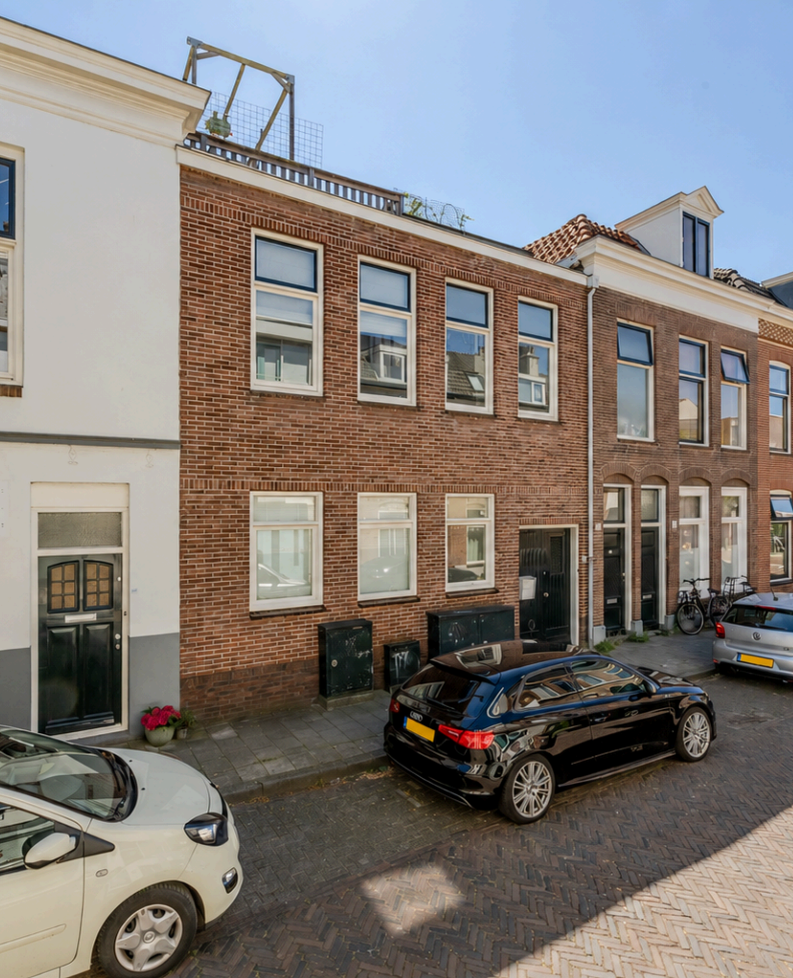
Frans Halsstraat 48 A, Haarlem