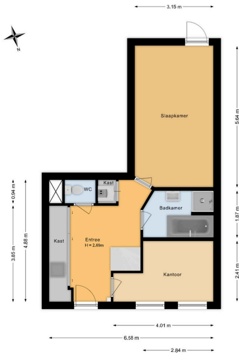
Frans Halsstraat 48 A Haarlem Begane grond

Deze plattegrond is met de grootst mogelijke zorg samengesteld. Desondanks kunnen er geen rechten aan worden ontleend en kunnen er kleine afwijking zijn in de exacte maatvoering. www.agvastgoedmedia.nl