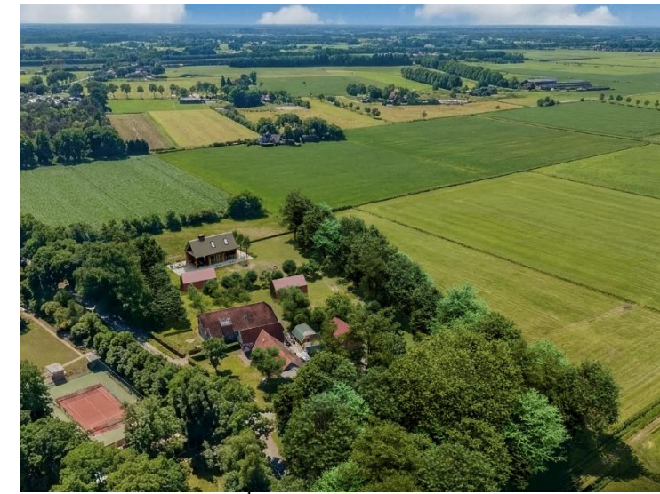
De kavels zijn gesitueerd in de nabijheid van een vakantiepark en bijbehorende tennisbaan