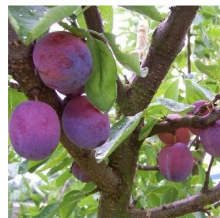
Prunus Domestica Opal