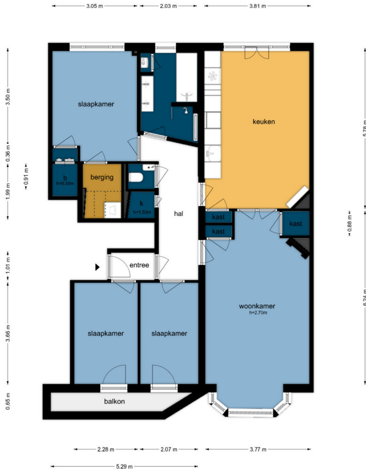
Rooseveltlaan 120-1 - Amsterdam Eerste Verdieping

De plattegronden zijn geproduceerd voor promotionele doeleinden en ter indicatie. Aan de plattegronden kunnen geen rechten worden ontleend.