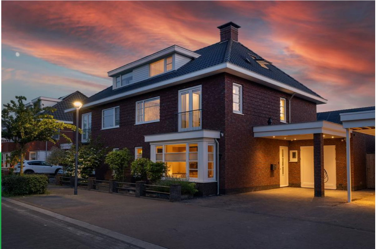
H.J.S. Taylorlaan 7, 7623 AZ Borne