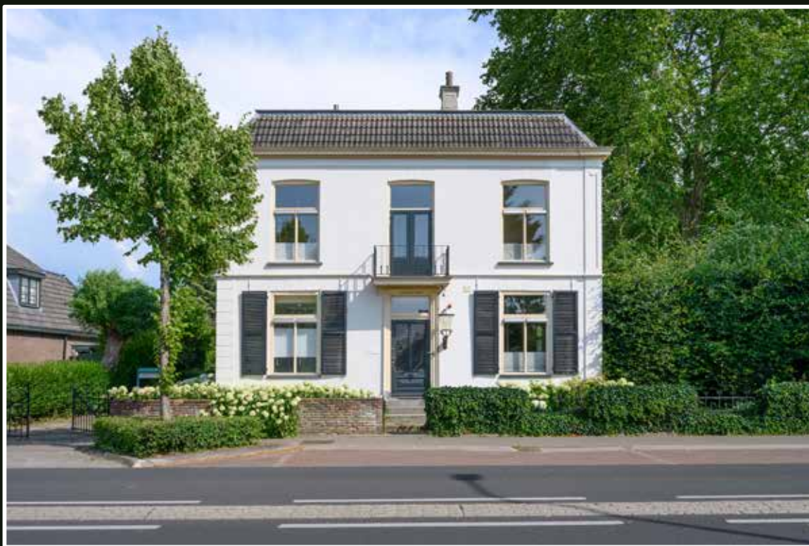
Leuvenheim Arnhemsestraat 81