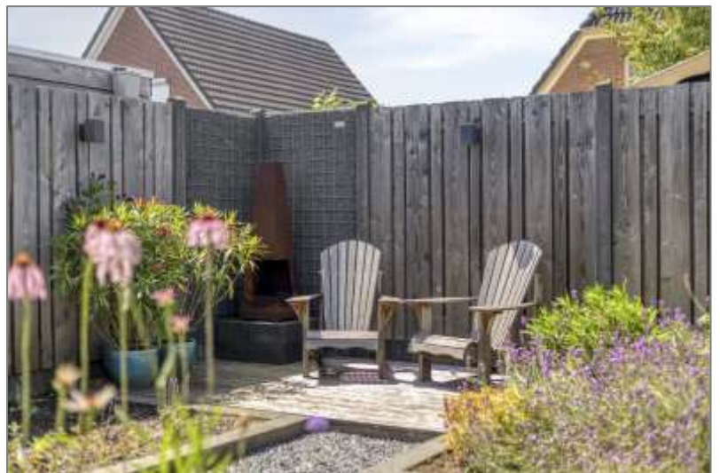
De Singel 4 - Varsseveld