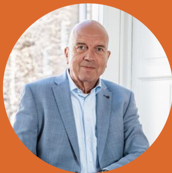
ERIK NVM Makelaar

We helpen je graag verder op weg naar jouw droomhuis.