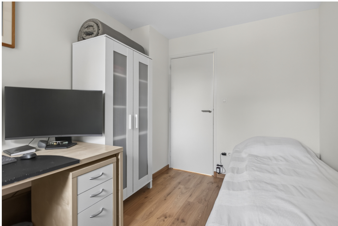
Slaapkamer 3 is aan achterzijde gelegen;