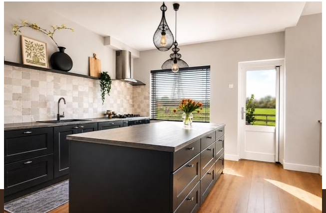
Gein Noord 89 Abcoude