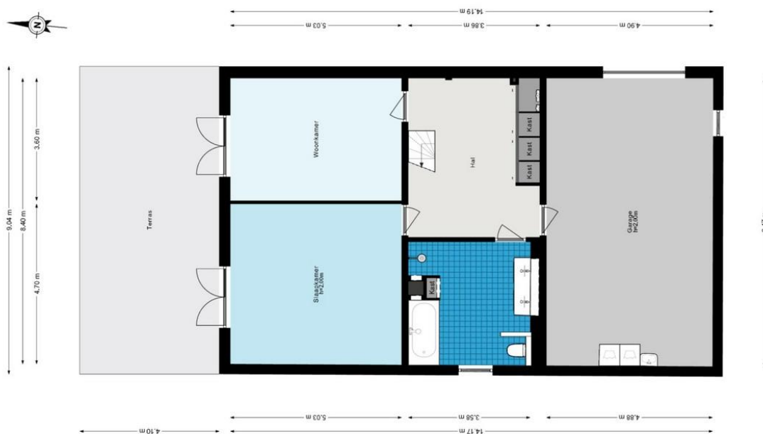
Gein Noord 89 - Abcoude Begane grond

De plattegronden zijn geproduceerd voor promotionele doeleinden en lie indicatie. Aan de plattegronden worden geen rechten voortvloeien. © www.raadhuis.nl