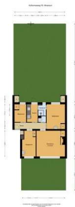
Kolhorneweg 78, Hilversum Externe berging