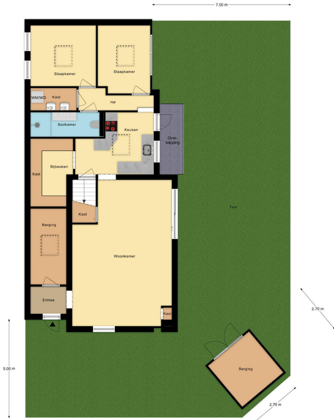
Kerkhoflaan 58 Zwanenburg Situatie