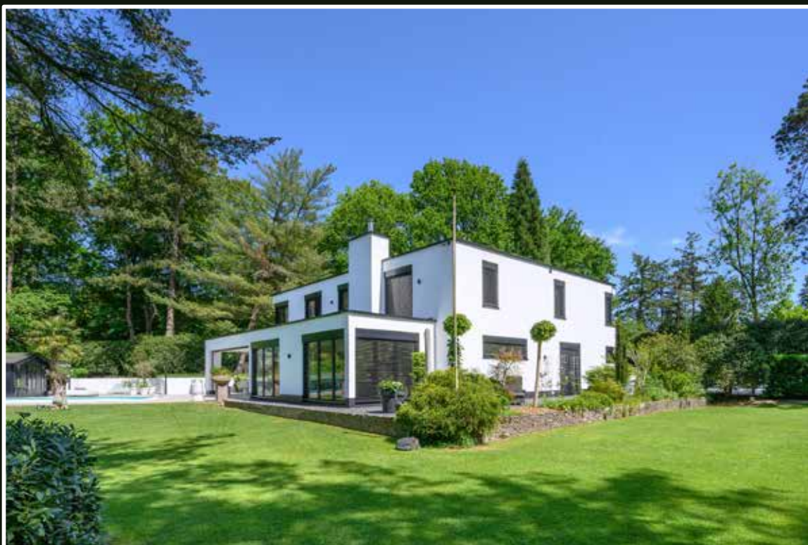
Gorsel Ravensweerdsweg 8