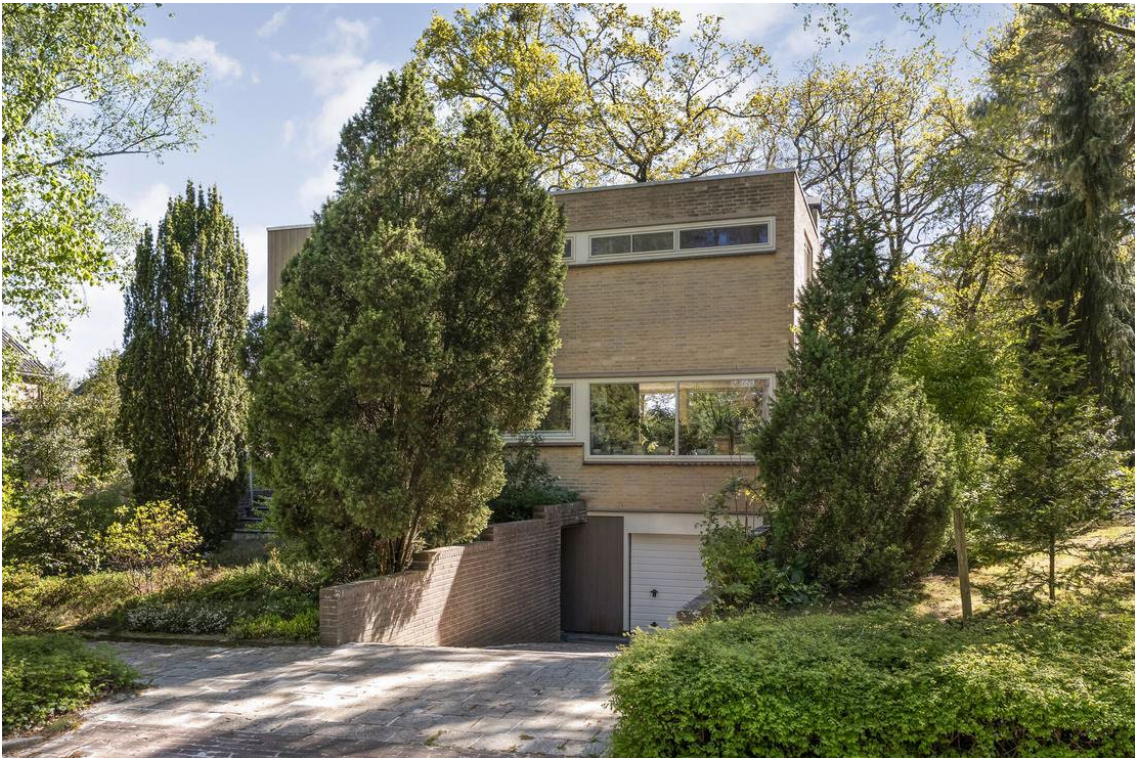
Arend Stegemanweg 3 te Nijverdal