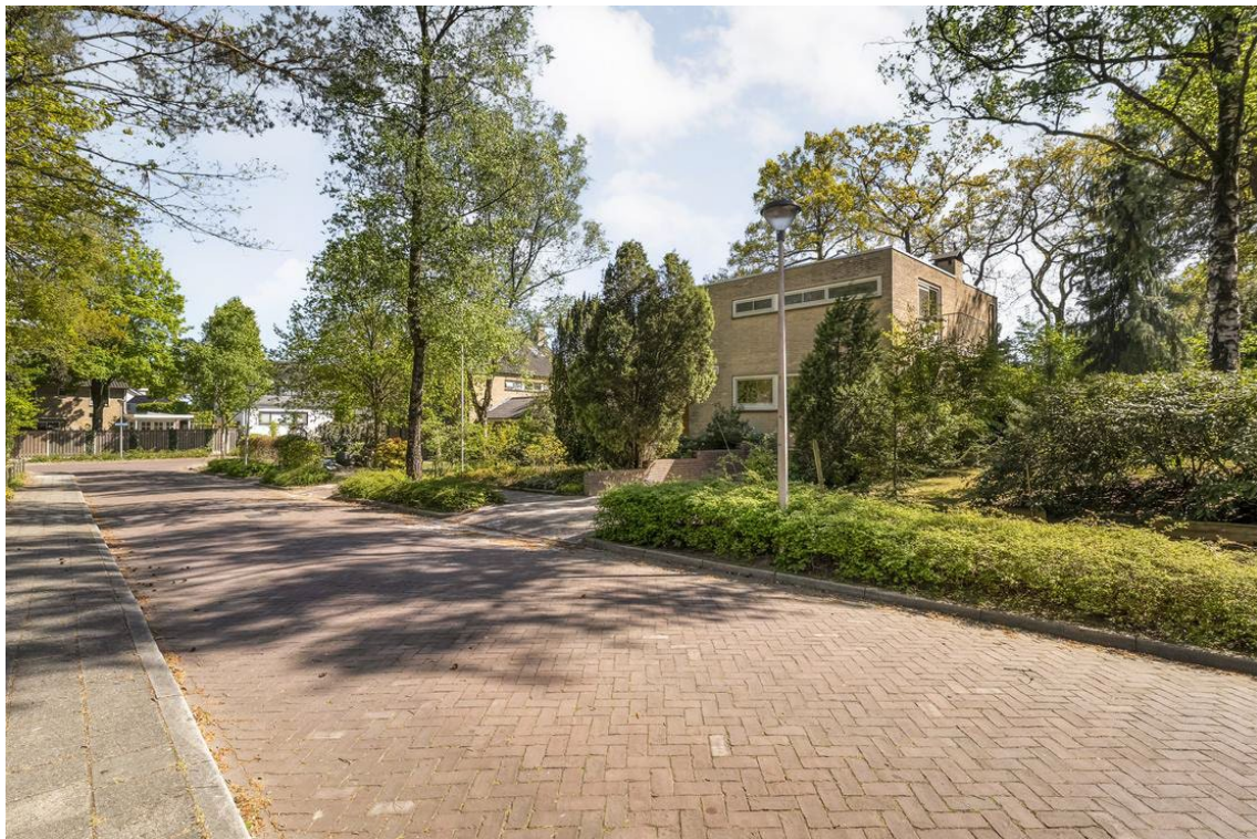
Arend Stegemanweg 3 te Nijverdal