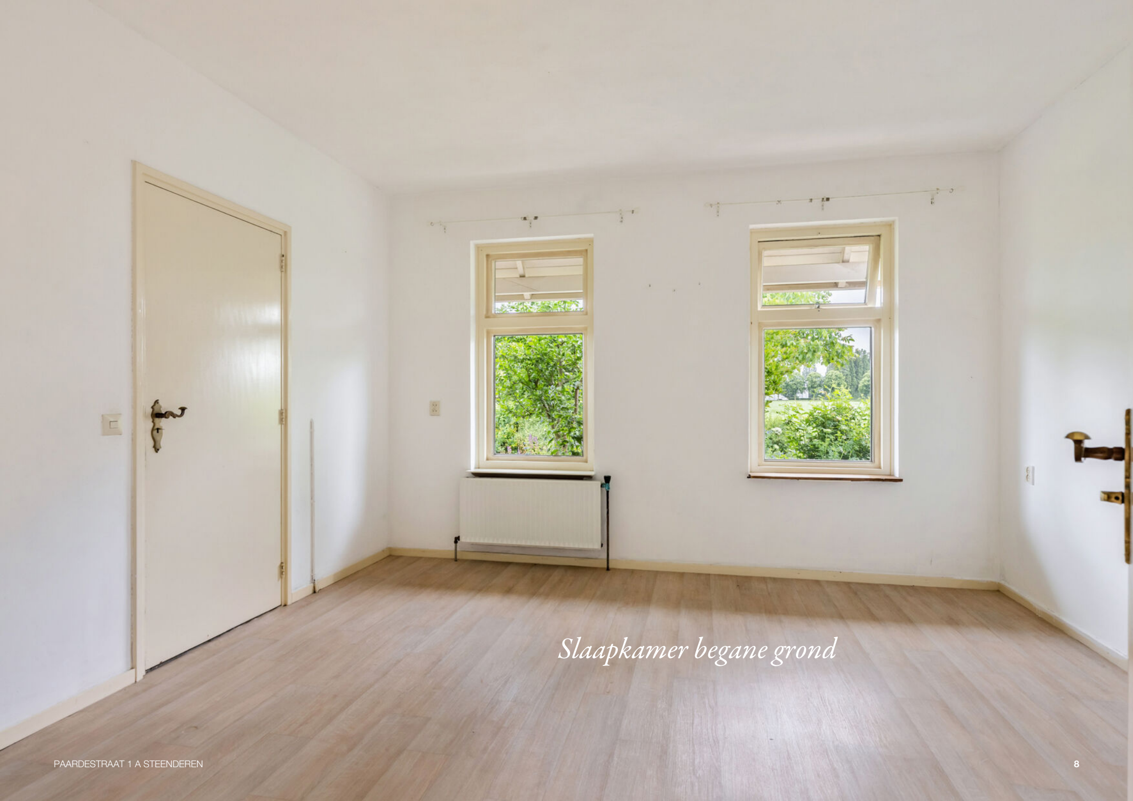
Slaapkamer begane grond