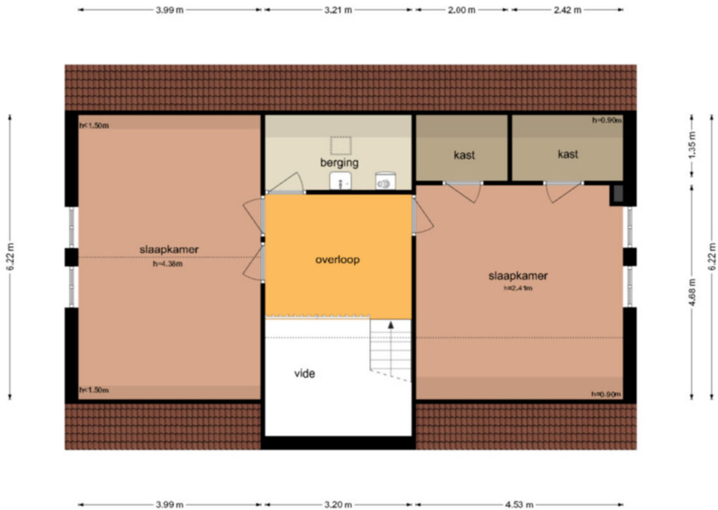
Paardestraat 1-A - Steenderen Eerste Verdieping

De plattegronden zijn geproduceerd voor promotionele doeleinden en ter indicatie. Aan de plattegronden kunnen geen rechten worden ontleend © www.objectenco.nl