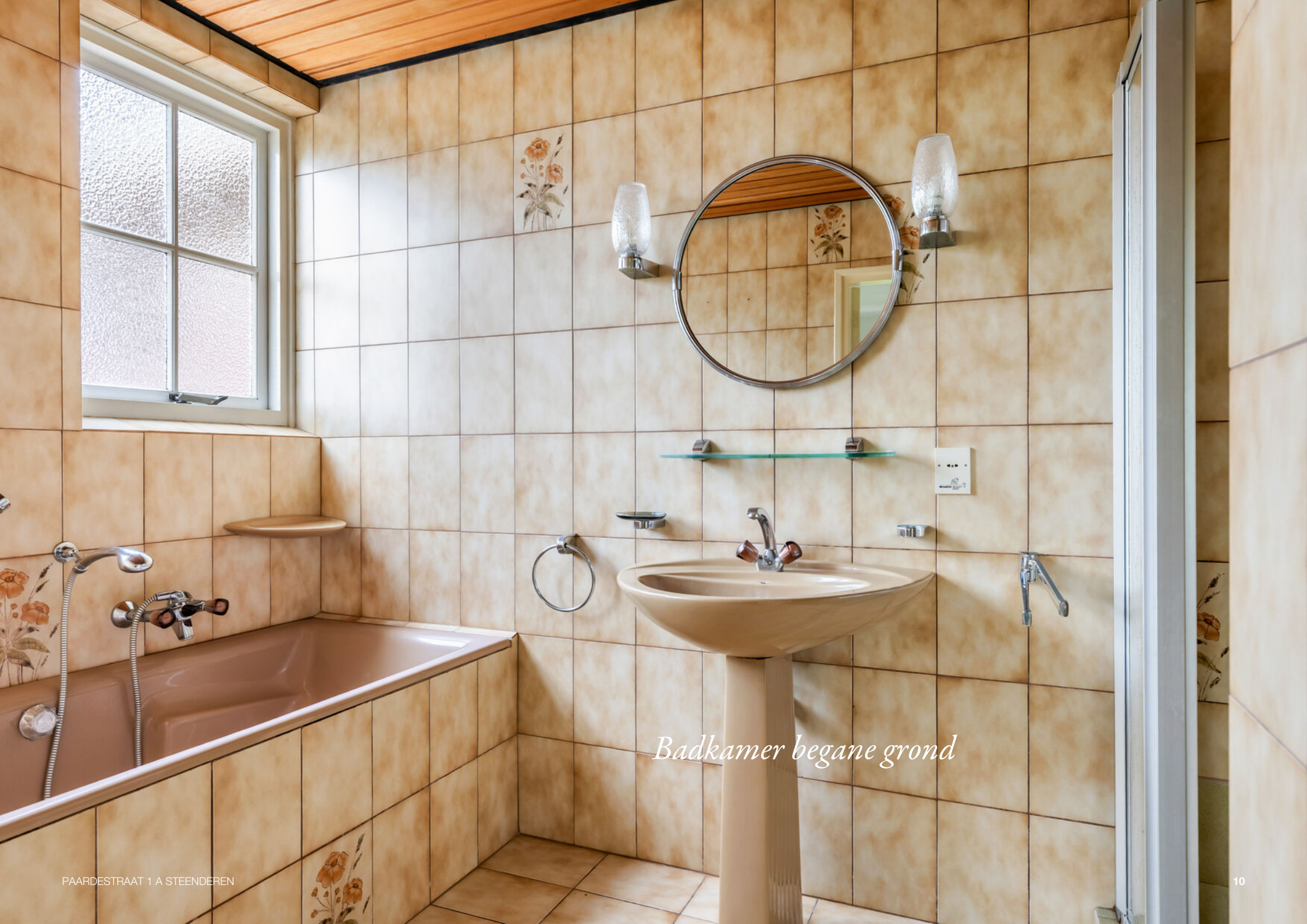
Badkamer begane grond