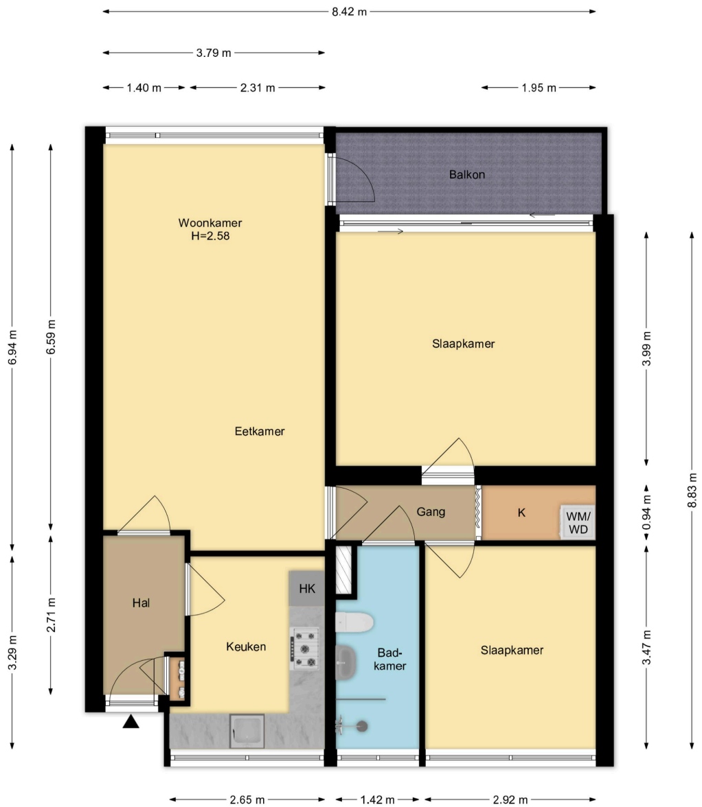
Appartement Engelandlaan 450, Haarlem R.M. Vastgoedpresentatie| Aan deze plattegrond kunnen geen rechten worden ontleend