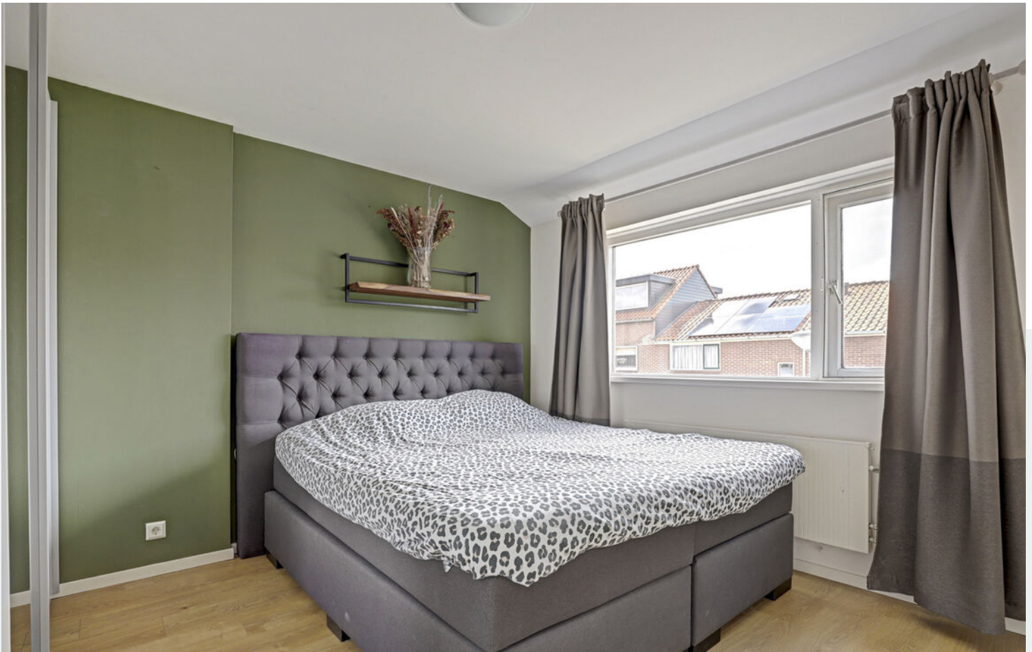
Slaapkamers 1e verdieping