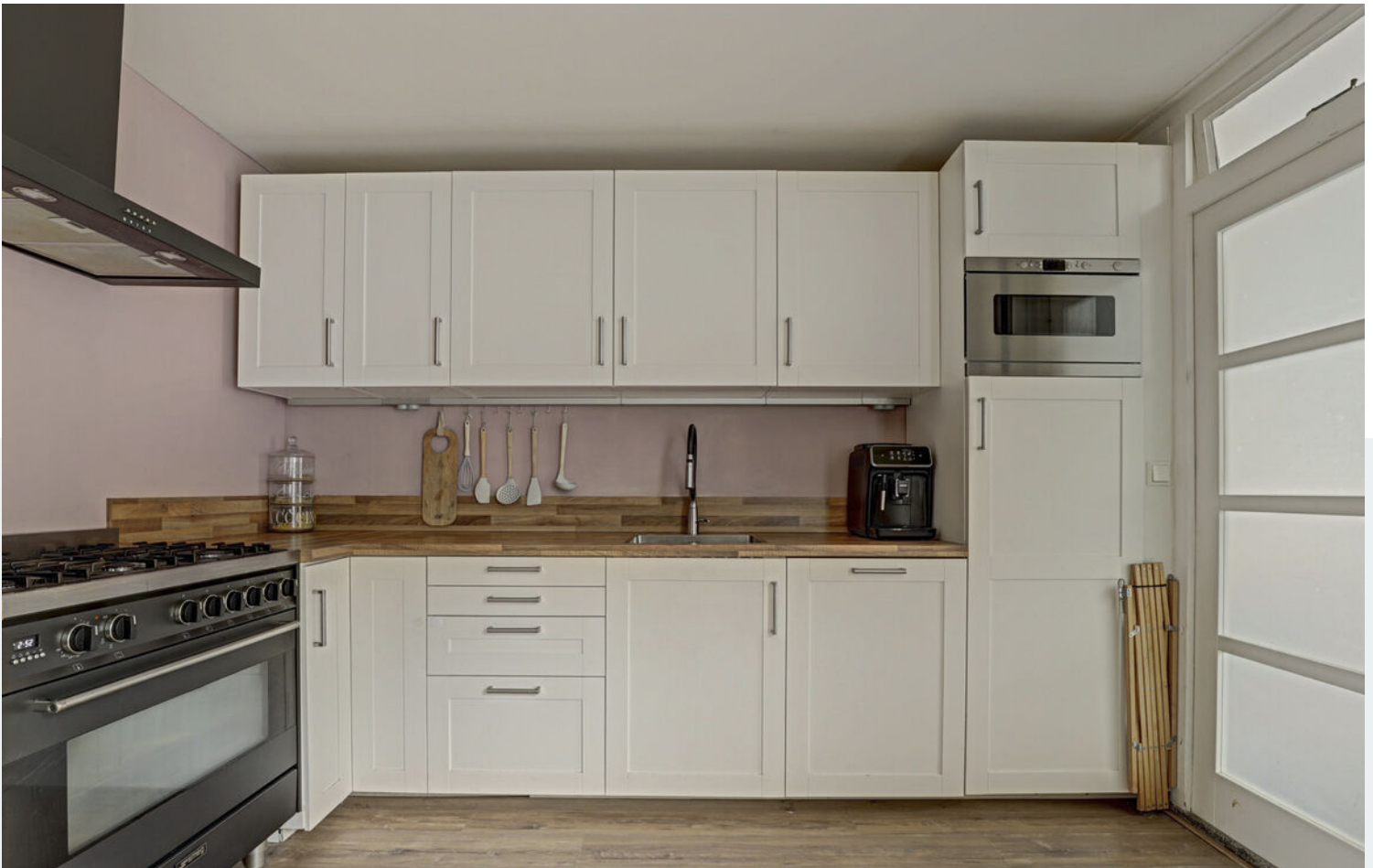
Entree, toilet en keuken