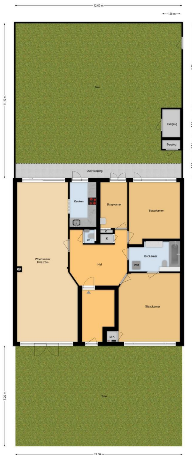
Laan van Nieuwoosteinde 186 Voorburg Situatie

De plattegronden zijn geproduceerd voor promotionele doeleinden en ter indicatie. Aan de plattegronden kunnen geen rechten worden ontleend. www.wonkeur999.nl