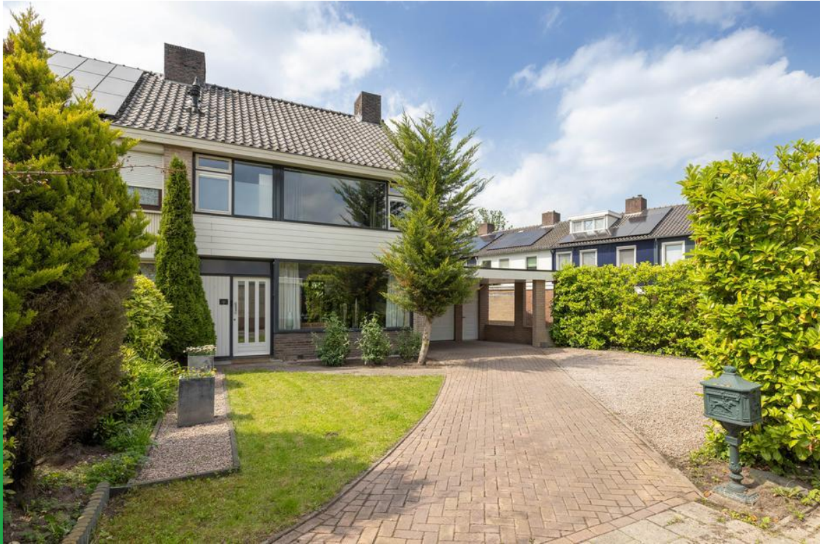
Dinkelstraat 18, 7555 KN Hengelo