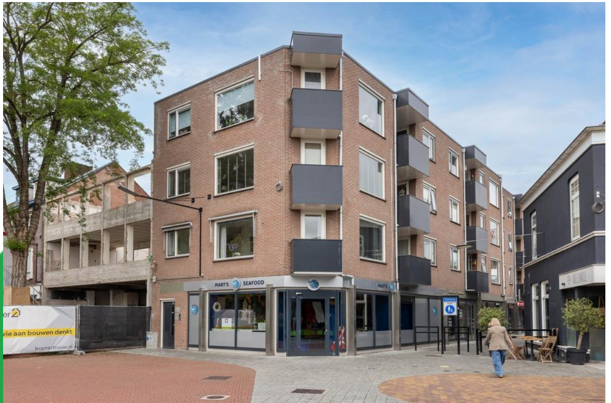
Wemenstraat 31, 7551 EV Hengelo