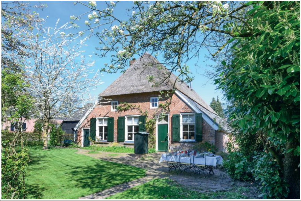
Ellecom Binnenweg 32