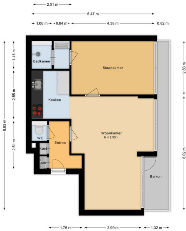
M Vaumontlaan 36 Heemstede 1e Verdieping

Deze plattegrond is met de grootst mogelijke zorg samengesteld. Desondanks kunnen er geen rechten aan worden ontleend en kunnen er kleine afwijking zijn in de exacte maatvoering. www.agvastgoedmedia.nl