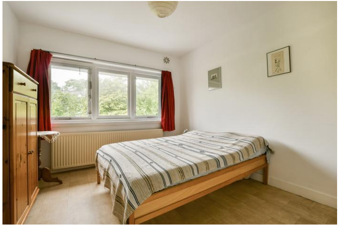
Ouddiemerlaan 47, 1111 GT Diemen