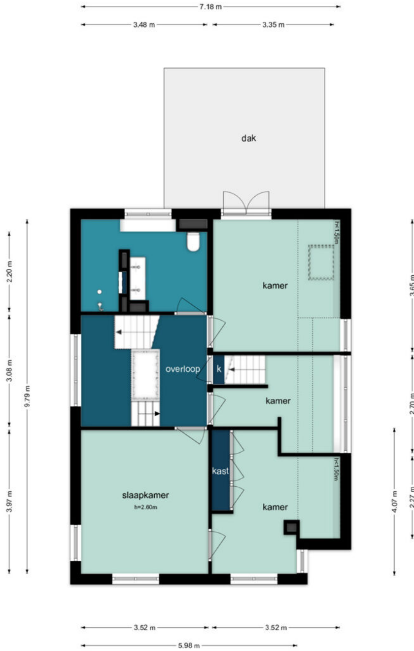
De hout 46 - Hem Eerste Verdieping

De plattegronden zijn geproduceerd voor promotionele doeleinden en ter indicatie. Aan de plattegronden kunnen geen rechten worden ontleend. ©www.woningvisueel.nl