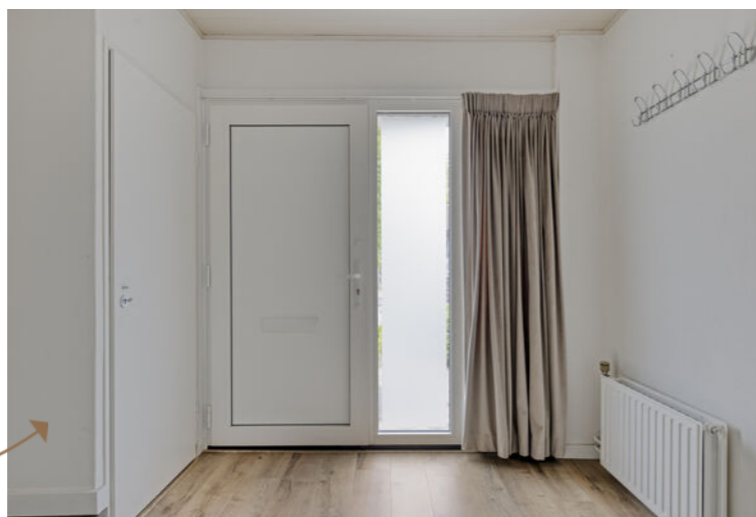
Ruime, lichte hal