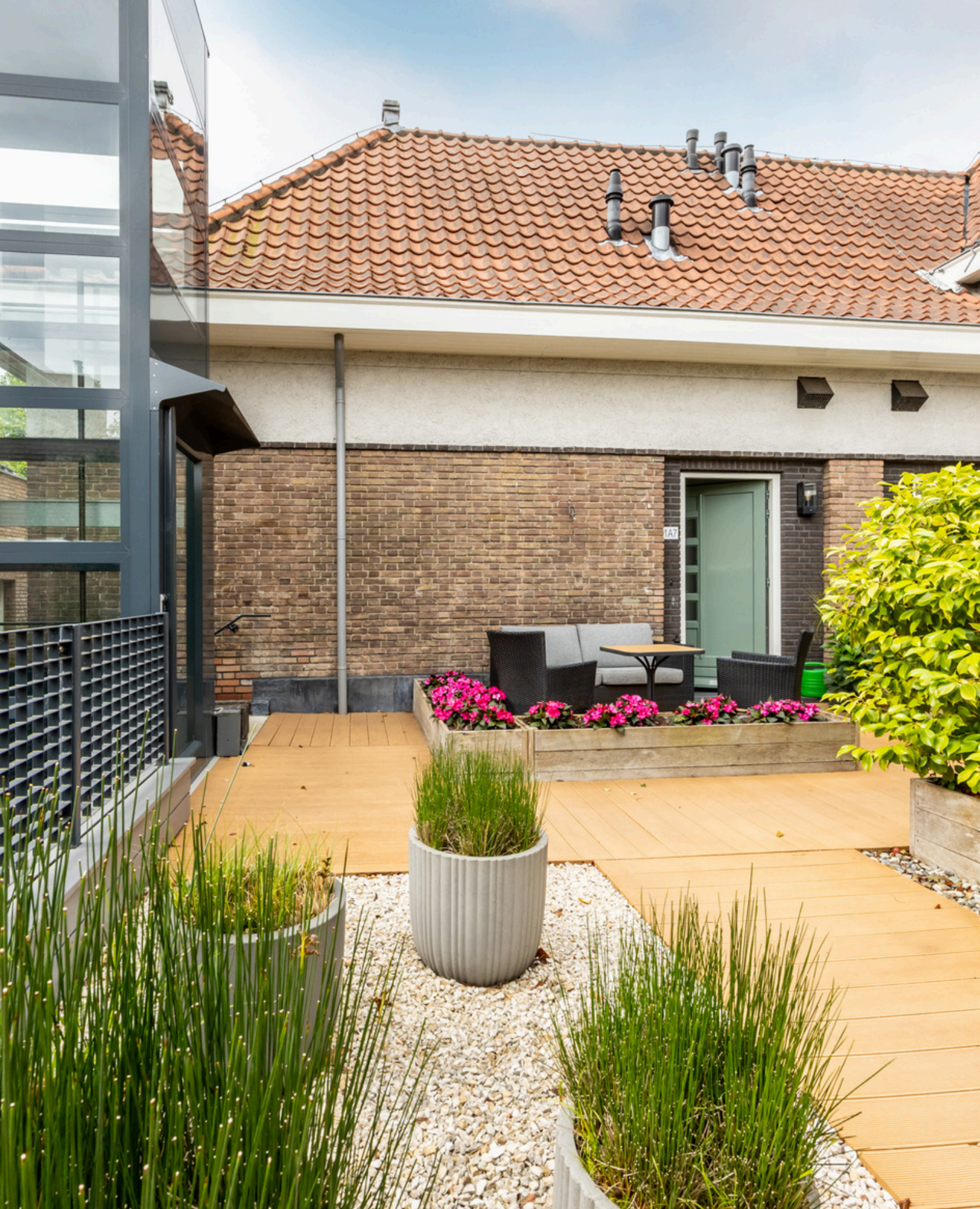
Postlaan 1 A7, Heemstede