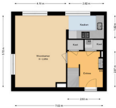
Postlaan 1 A 7 Heemstede 1e Verdieping

Deze plattegrond is met de grootst mogelijke zorg samengesteld. Desondanks kunnen er geen rechten aan worden ontleend en kunnen er kleine afwijking zijn in de exacte maatvoering. www.agvastgoedmedia.nl