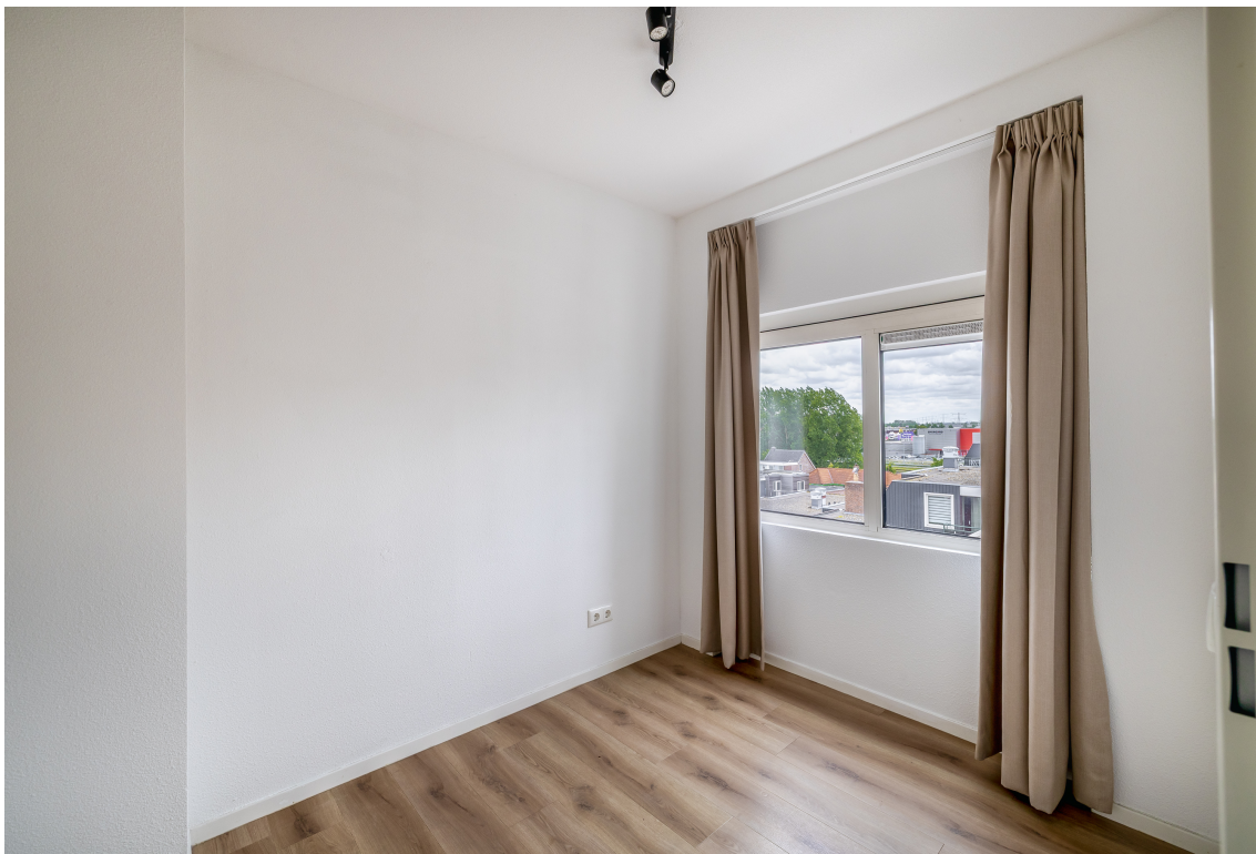
Graaf Janstraat 30, Beverwijk