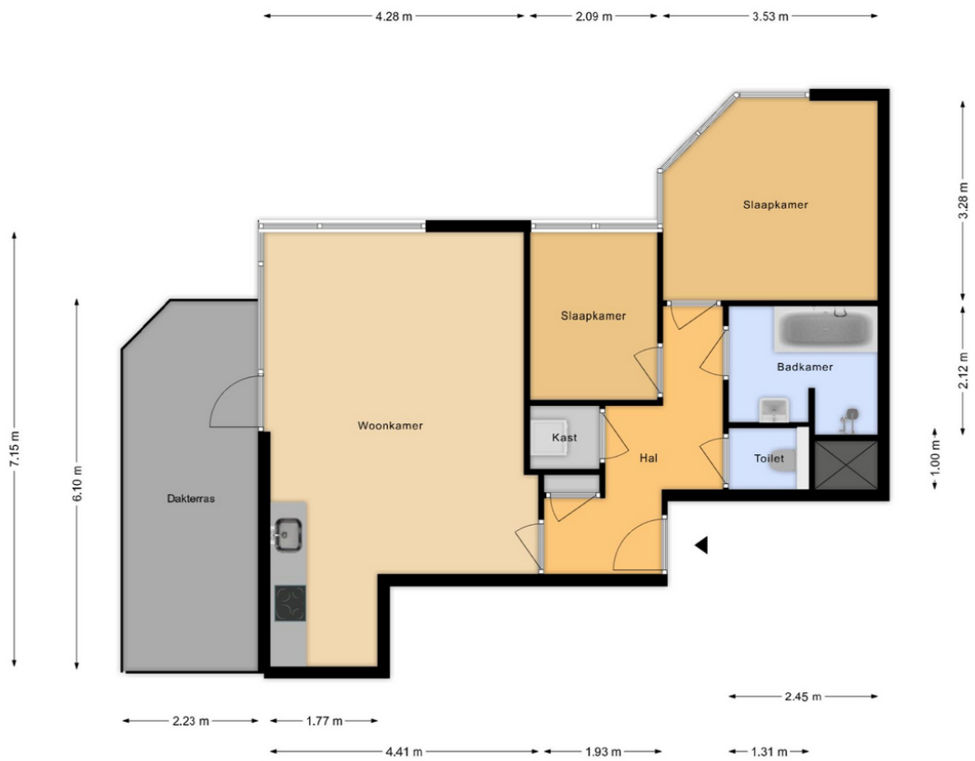
Graaf Janstraat 30 Appartement

De plattegronden zijn met zorg samengesteld. Aan de plattegronden kunnen geen rechten worden ontleend! Wesselius Vastgoedpresentaties