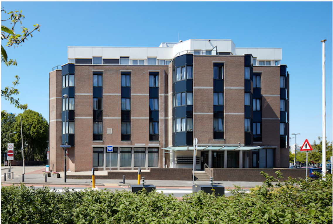
Graaf Janstraat 30, Beverwijk