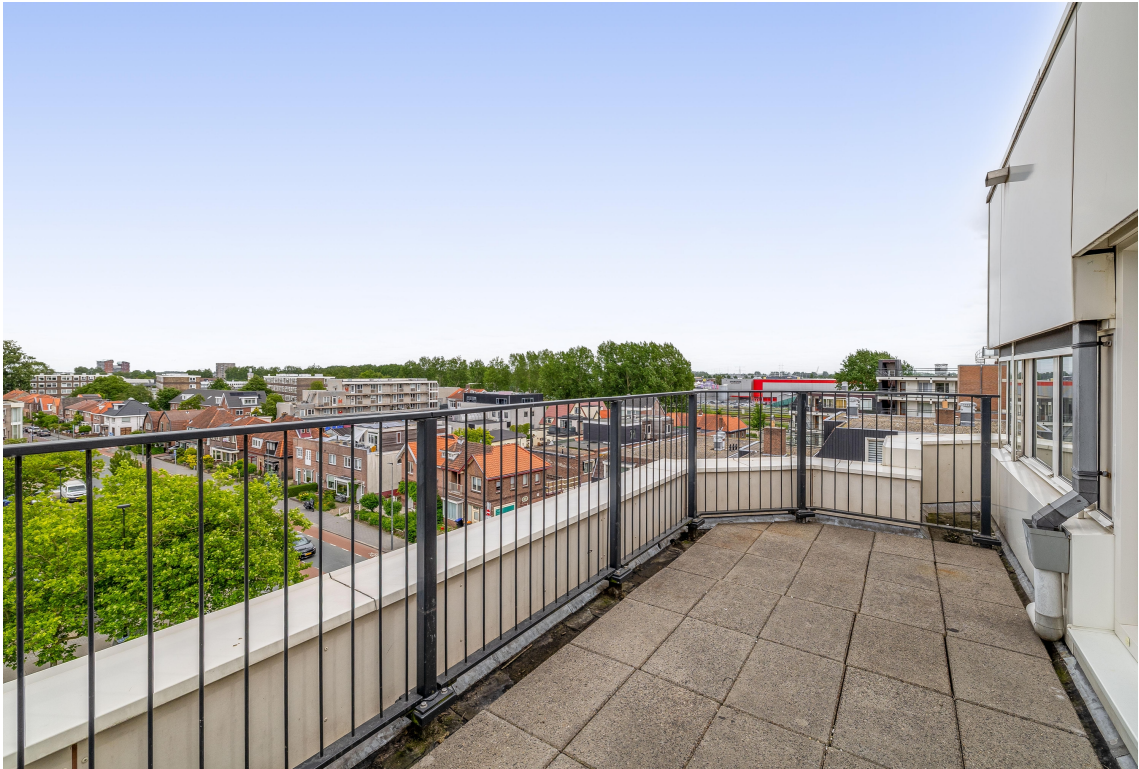
Graaf Janstraat 30, Beverwijk