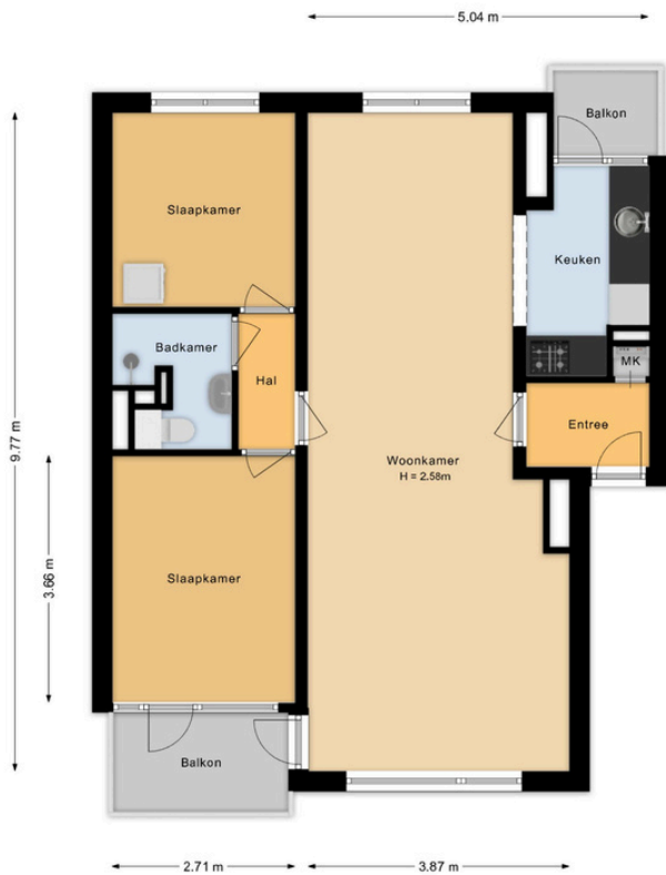
Delftlaan 317 - 4 Haarlem 4e Verdieping

Deze plattegrond is met de grootst mogelijke zorg samengesteld. Desondanks kunnen er geen rechten aan worden ontleend en kunnen er kleine afwijking zijn in de exacte maatvoering. www.agvastgoedmedia.nl