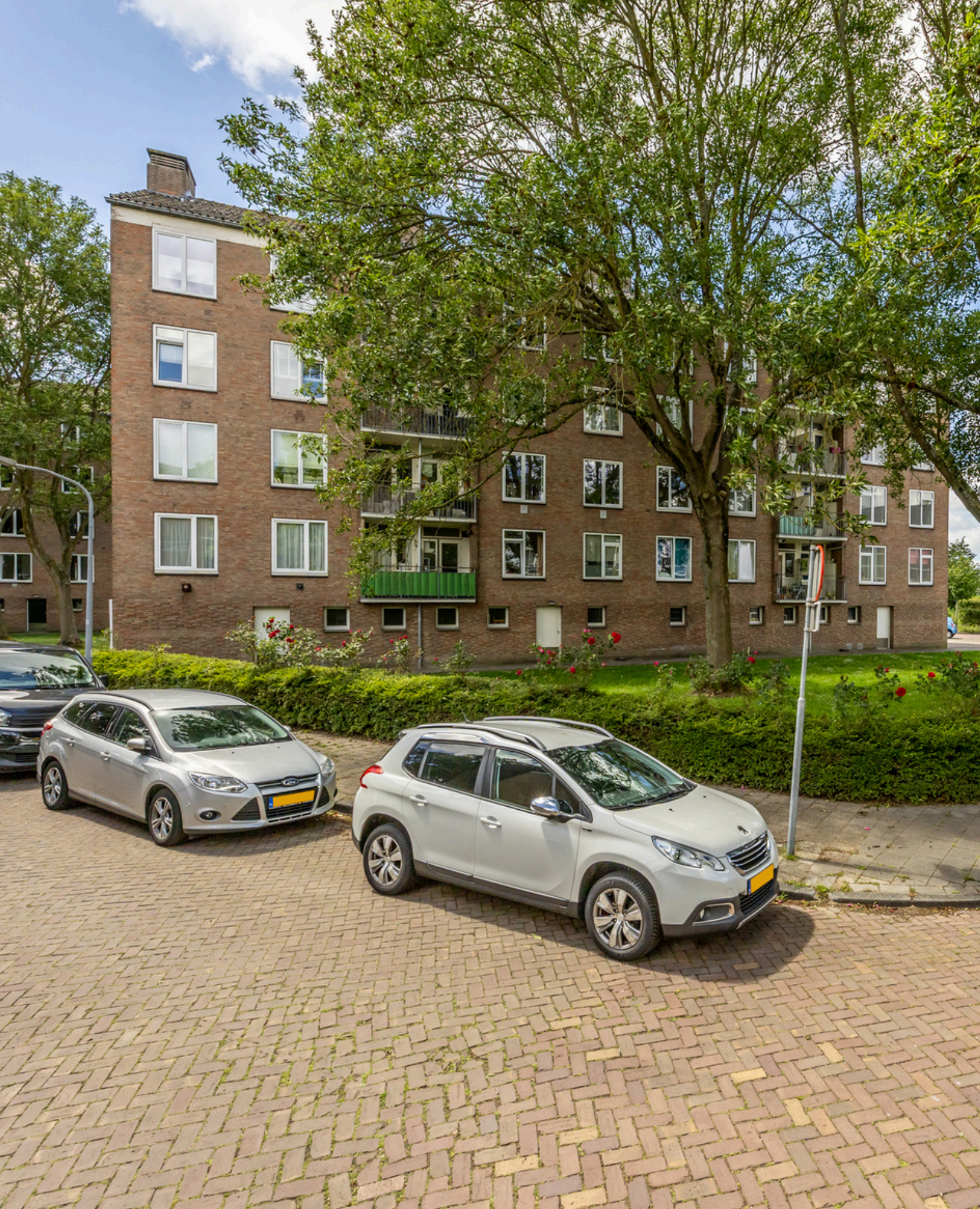
Delftlaan 317 IV, Haarlem