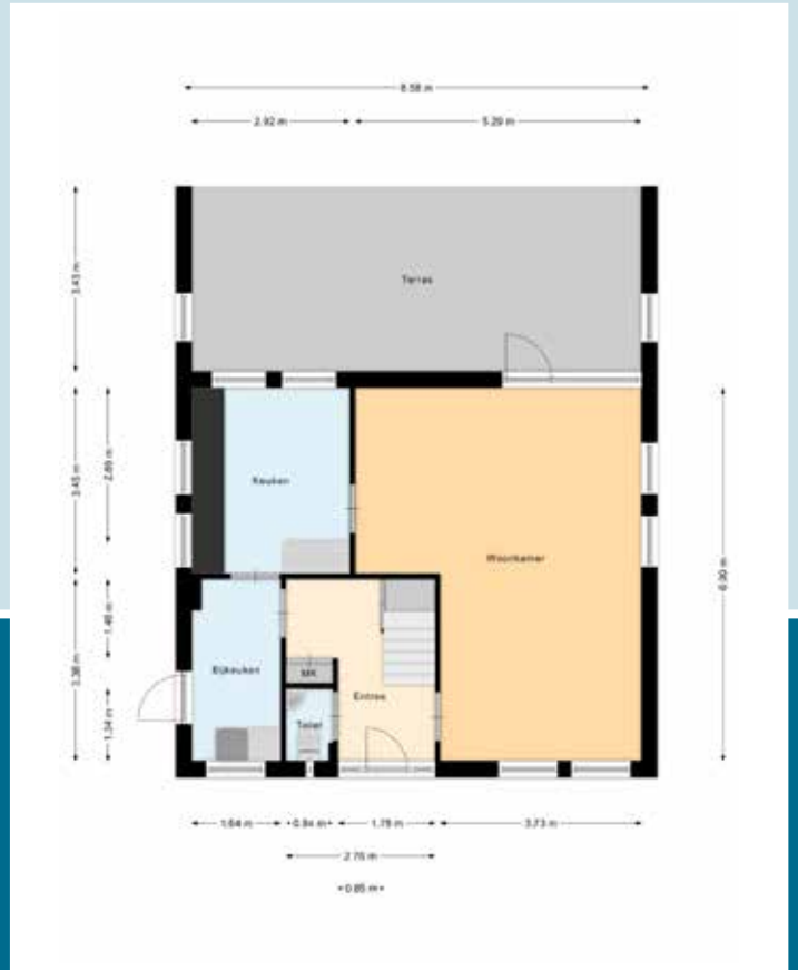
Indeling begane grond