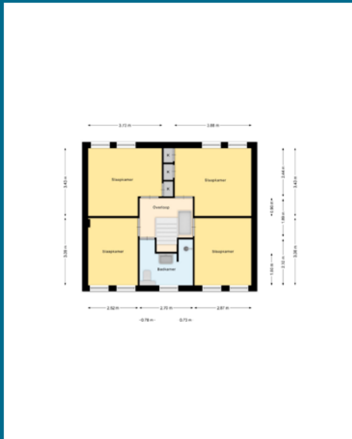
Indeling 1 ste verdieping