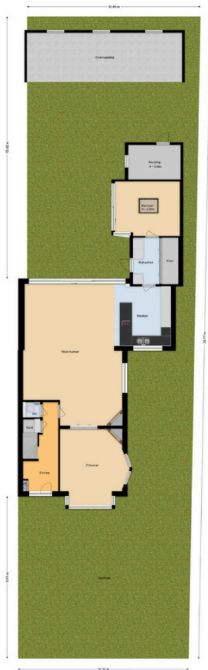
Burgemeester van Lennepweg 24 - Heemstede Situatie

Deze plattegrond is met de grootst mogelijke zorg samengesteld. Desondanks kunnen er geen rechten aan worden ontleend en kunnen er kleine afwijking zijn in de exacte maatvoering. www.agvastgoedmedia.nl