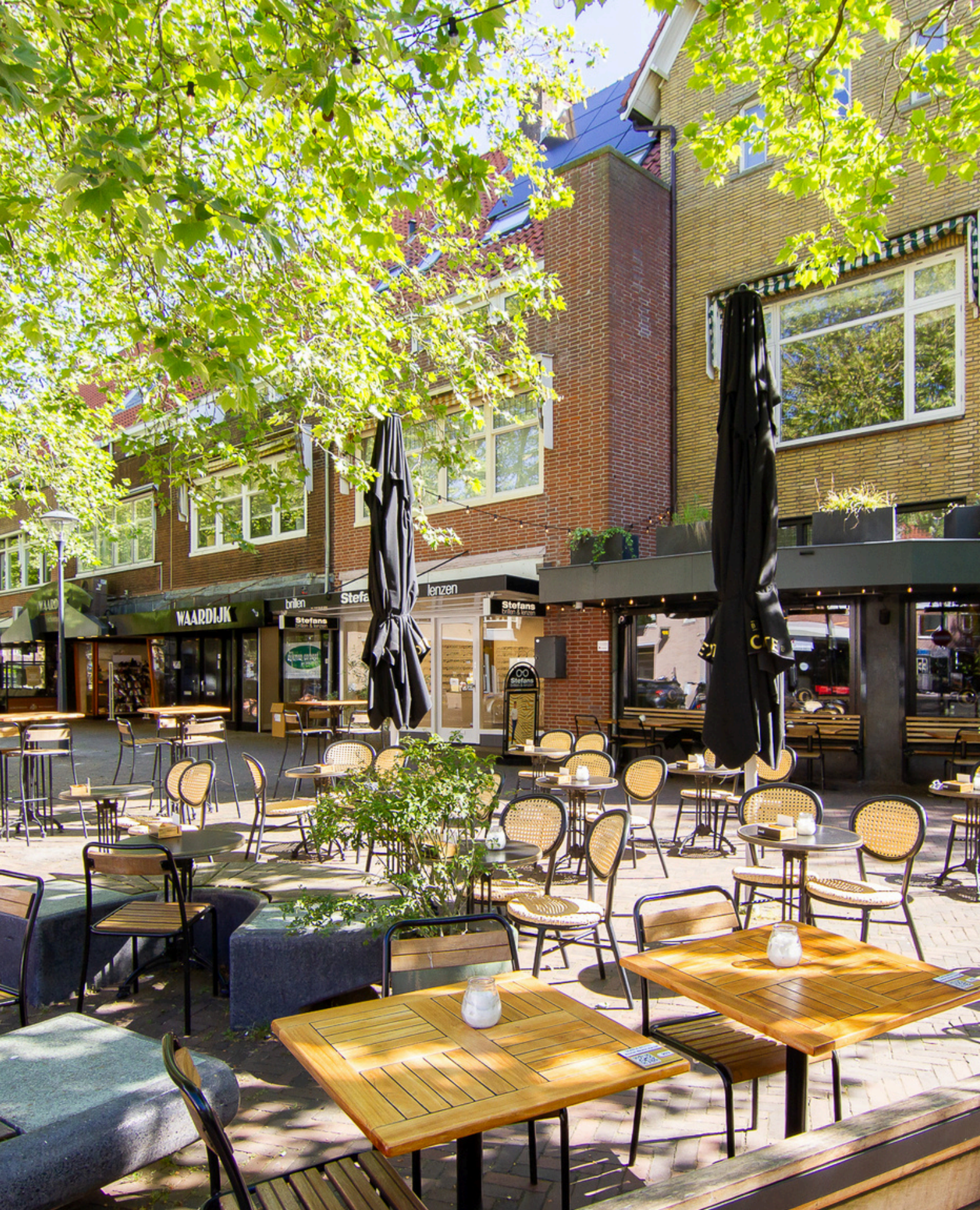
Burgemeester van Lennepweg 24, Heemstede