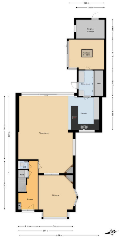
Burgemeester van Lennepweg 24 - Heemstede Begane grond

Deze plattegrond is met de grootst mogelijke zorg samengesteld. Desondanks kunnen er geen rechten aan worden ontleend en kunnen er kleine afwijking zijn in de exacte maatvoering. www.agvastgoedmedia.nl