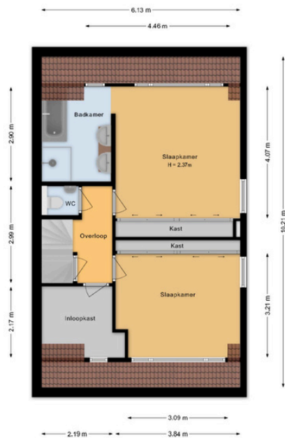
Burgemeester van Lennepweg 24 - Heemstede 1e Verdieping

Deze plattegrond is met de grootst mogelijke zorg samengesteld. Desondanks kunnen er geen rechten aan worden ontleend en kunnen er kleine afwijking zijn in de exacte maatvoering. www.agvastgoedmedia.nl