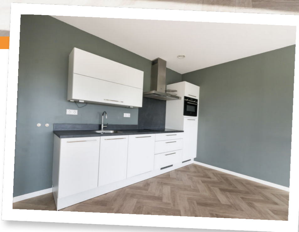
Tijdloze keuken met Siemens apparatuur.