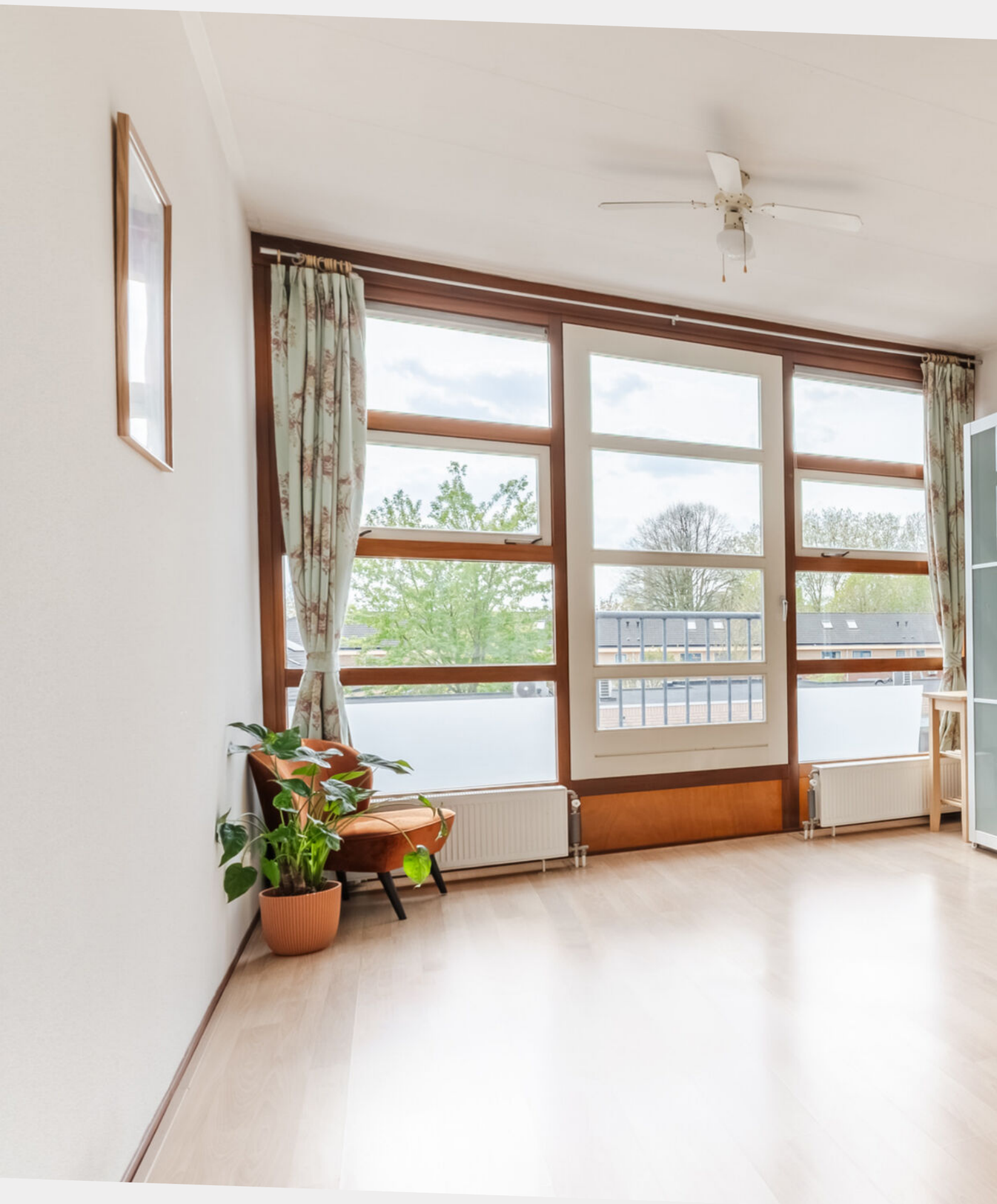
Woon-/slaapkamer met verassend veel daglicht en strakke afwerking!