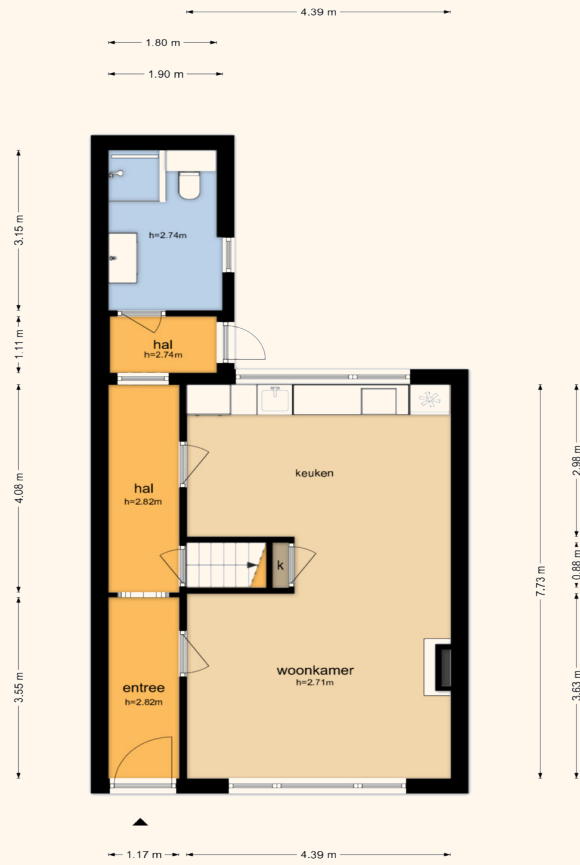
Voorstraat 37 - Groede Begane Grond

De plattegronden zijn geproduceerd voor promotionele doeleinden en ter indicatie. Aan de plattegronden kunnen geen rechten worden ontleend.