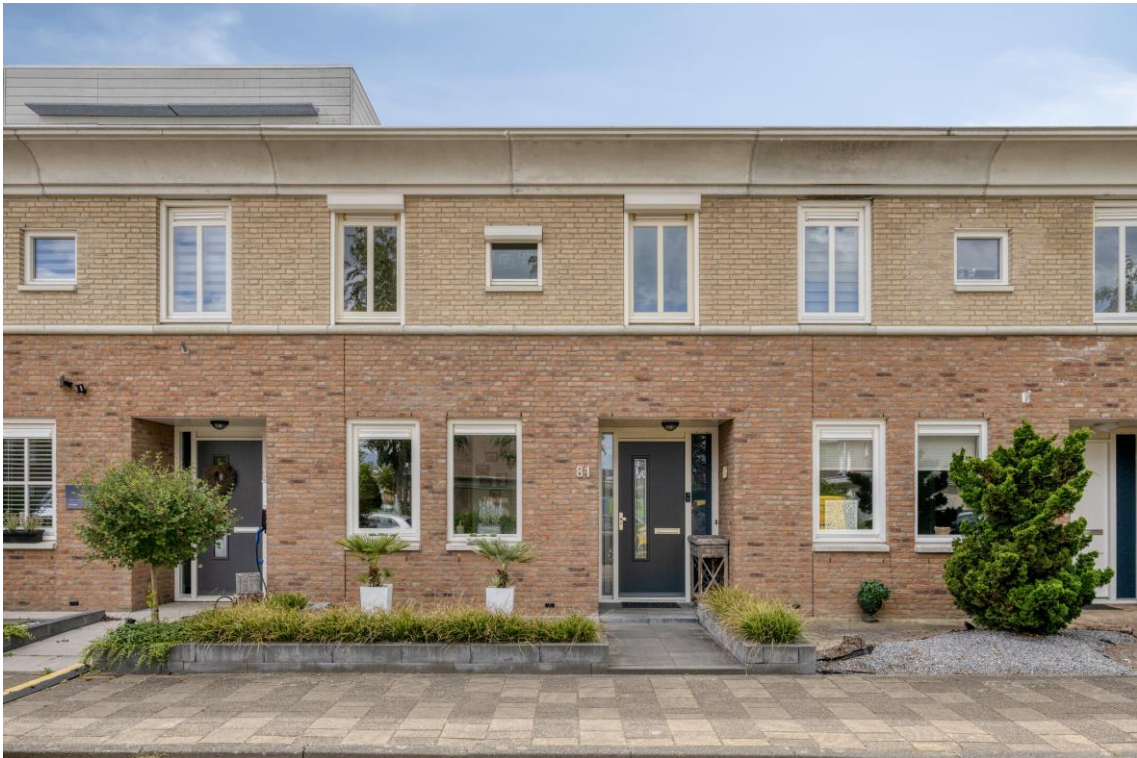
Otello 81 te Eindhoven