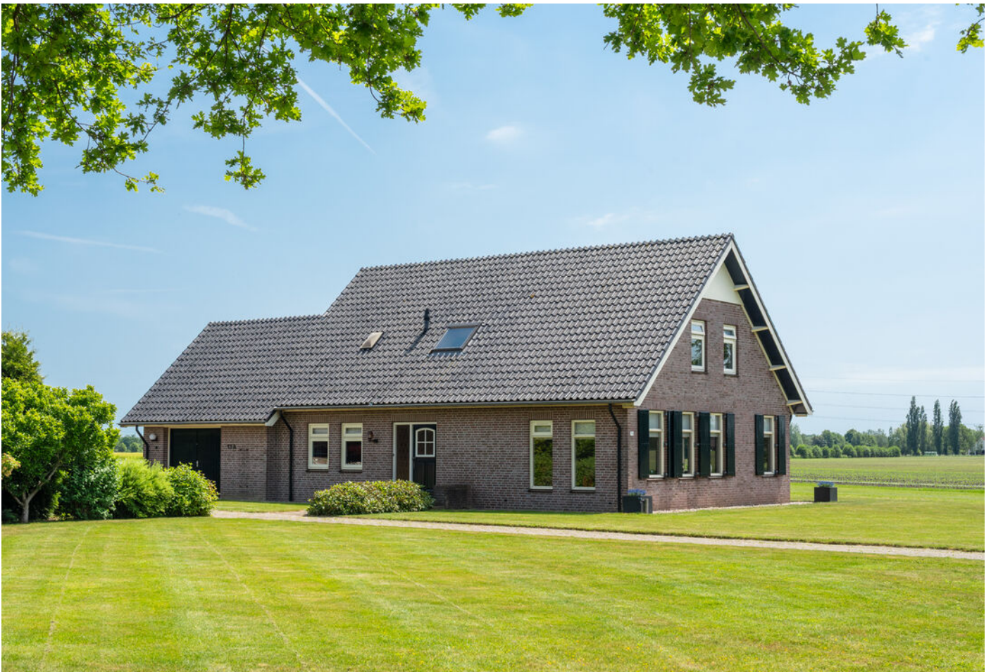
Kapelweg 13 A, Sinderen