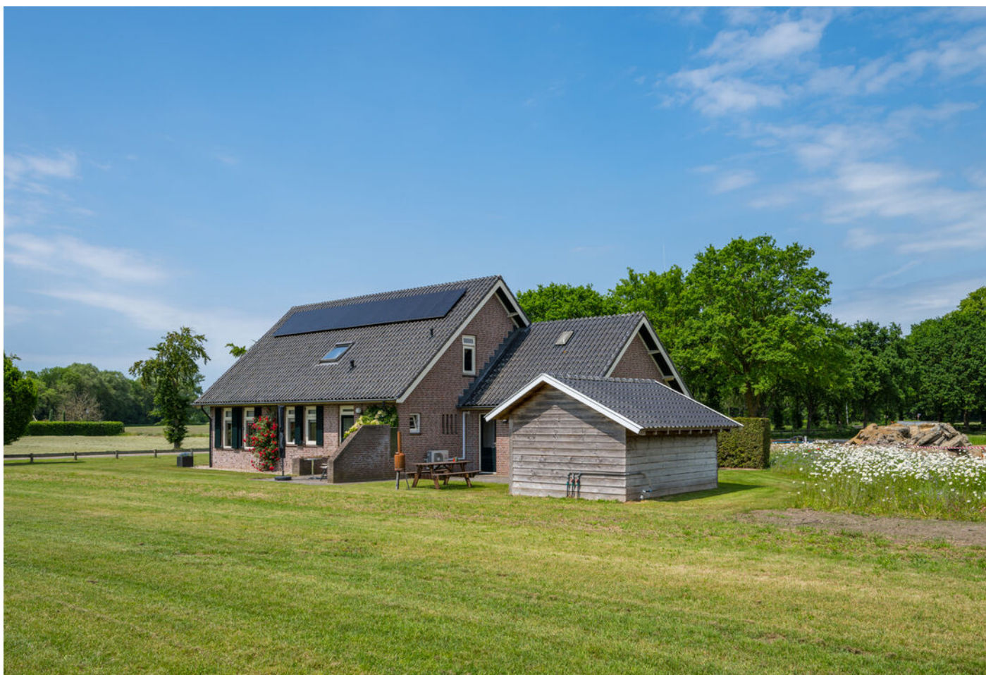
Kapelweg 13 A, Sinderen