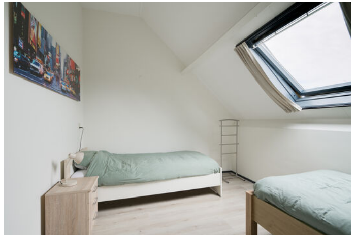
Kapelweg 13 A, Sinderen