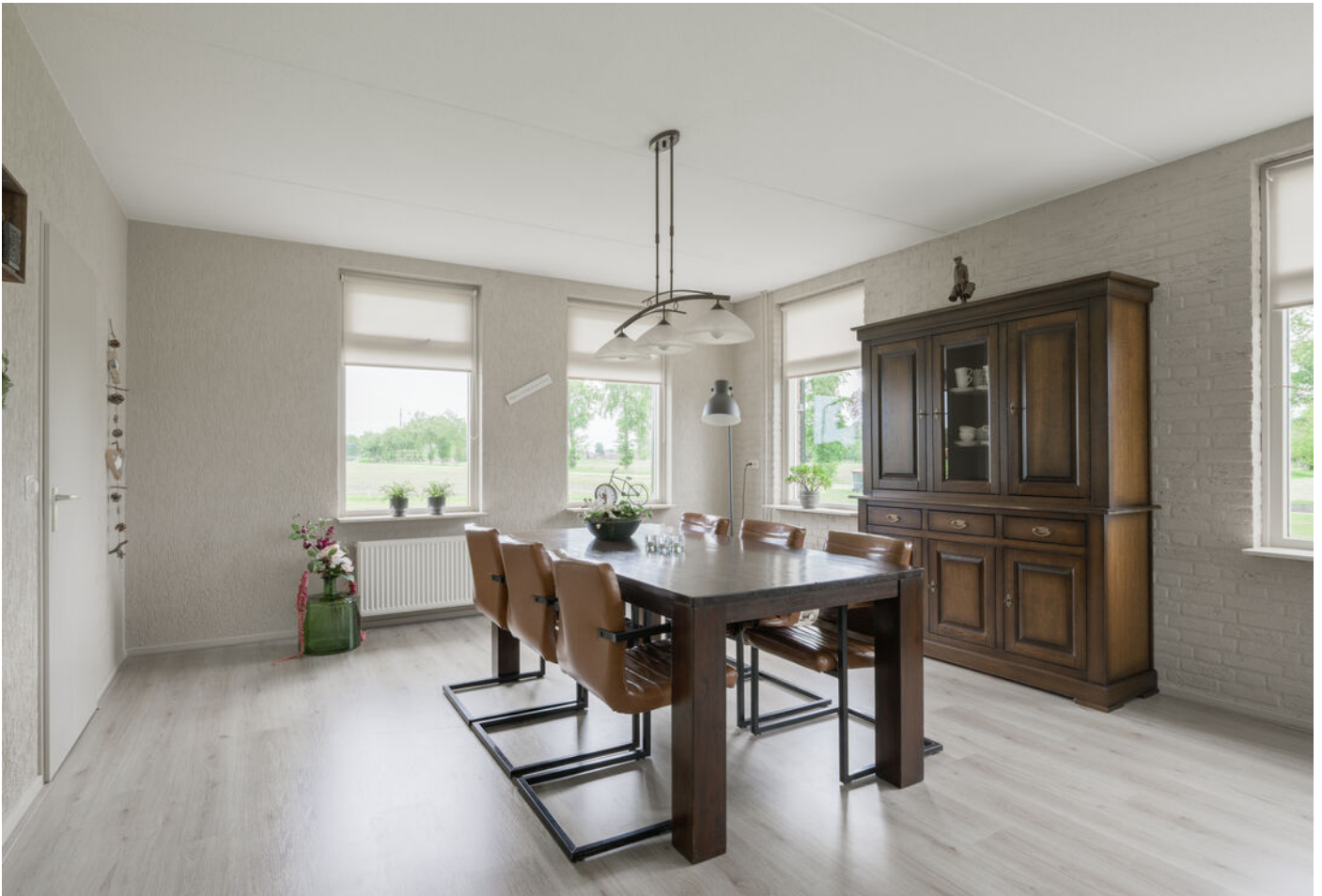
Kapelweg 13 A, Sinderen