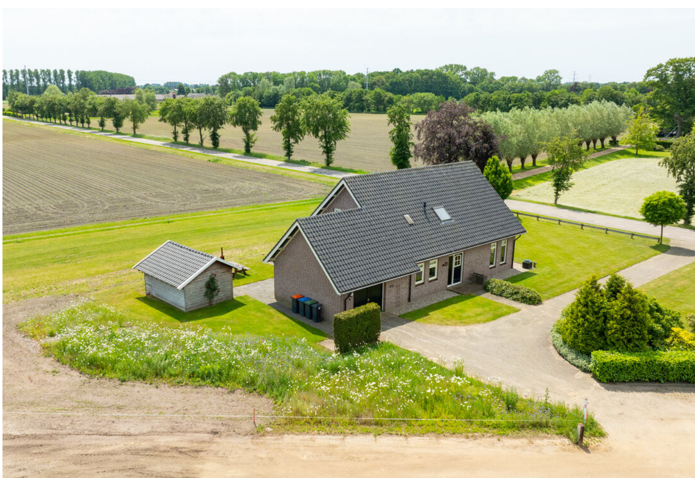
Kapelweg 13 A, Sinderen