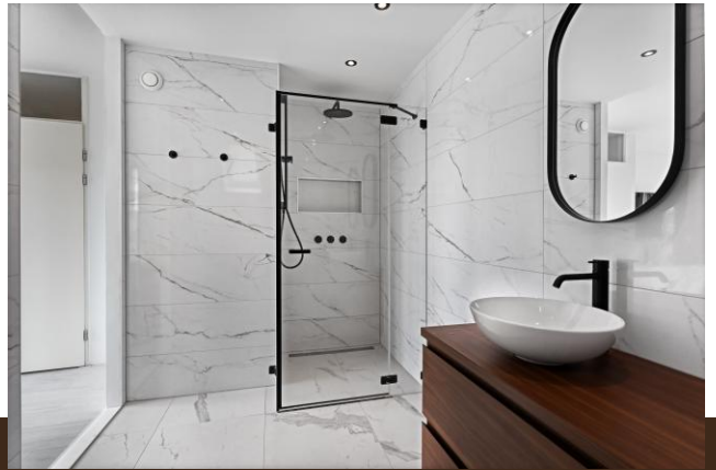
Bergvliet 7 Abcoude