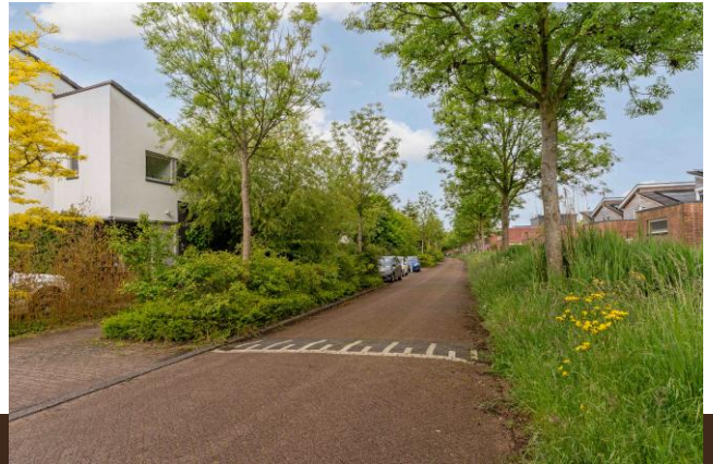
Bergvliet 7 Abcoude