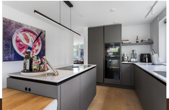
Bergvliet 7 Abcoude