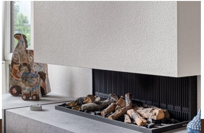
Bergvliet 7 Abcoude