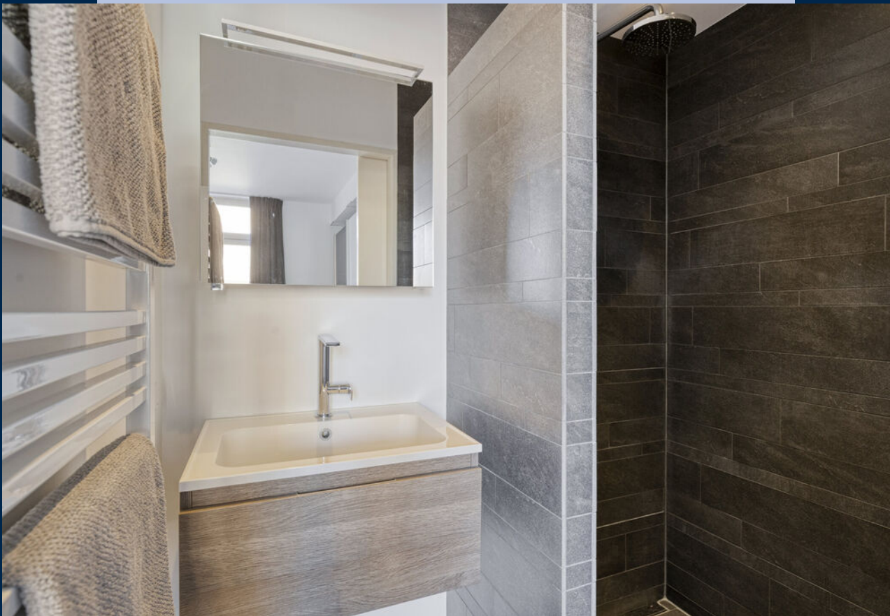
De badkamer is voorzien van een wastafelmeubel en douche.