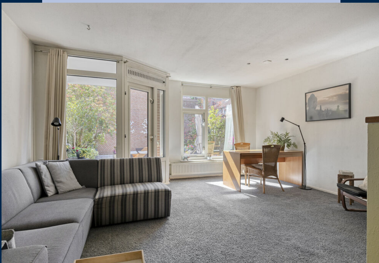
De woonkamer heeft prettig lichtinval en staat in directe verbinding met het dakterras.