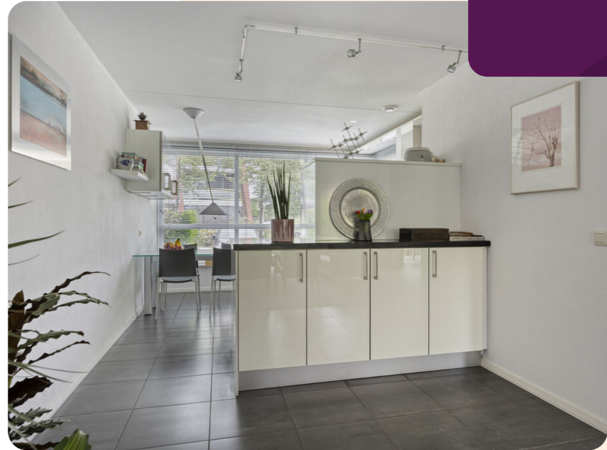
Een moderne keuken