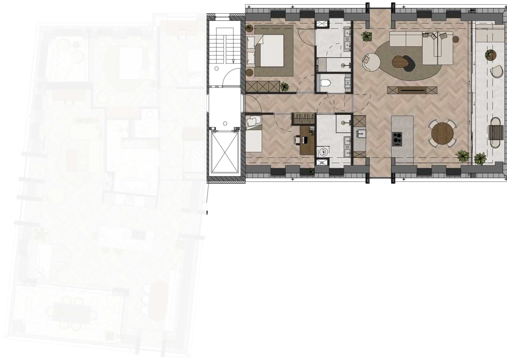
PLATTEGROND - APPARTEMENT 2