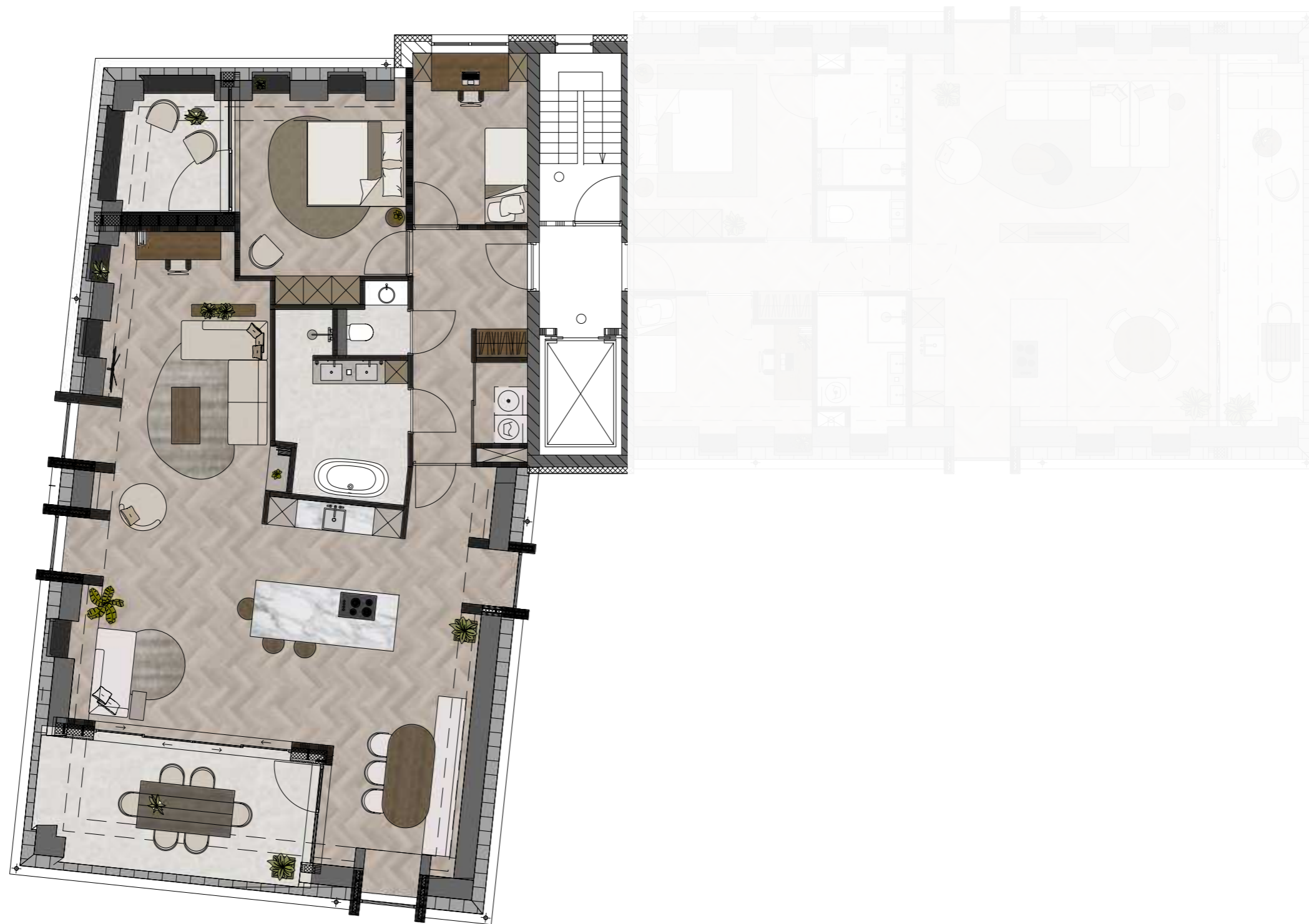
PLATTEGROND - APPARTEMENT 3