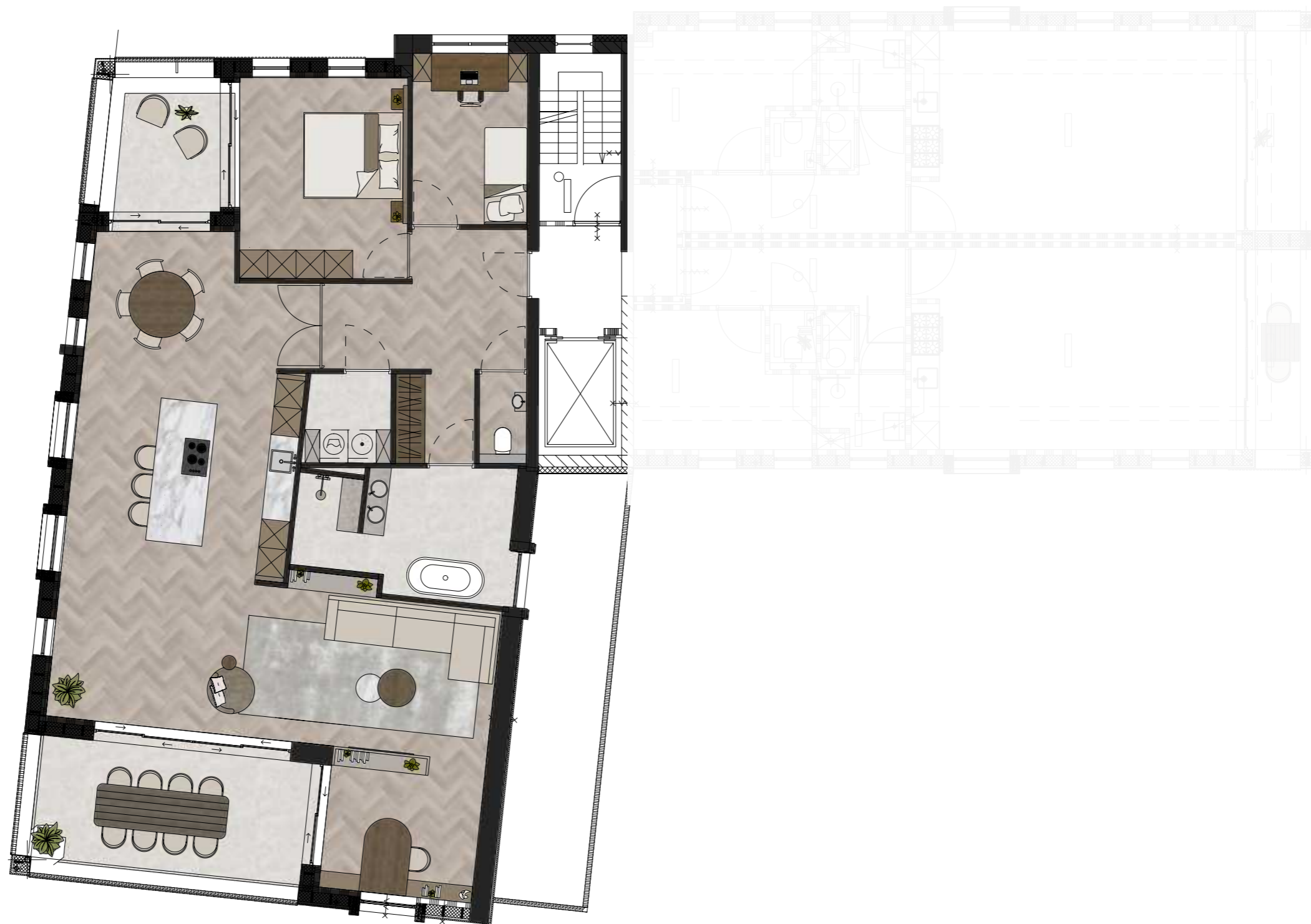
PLATTEGROND - APPARTEMENT 1