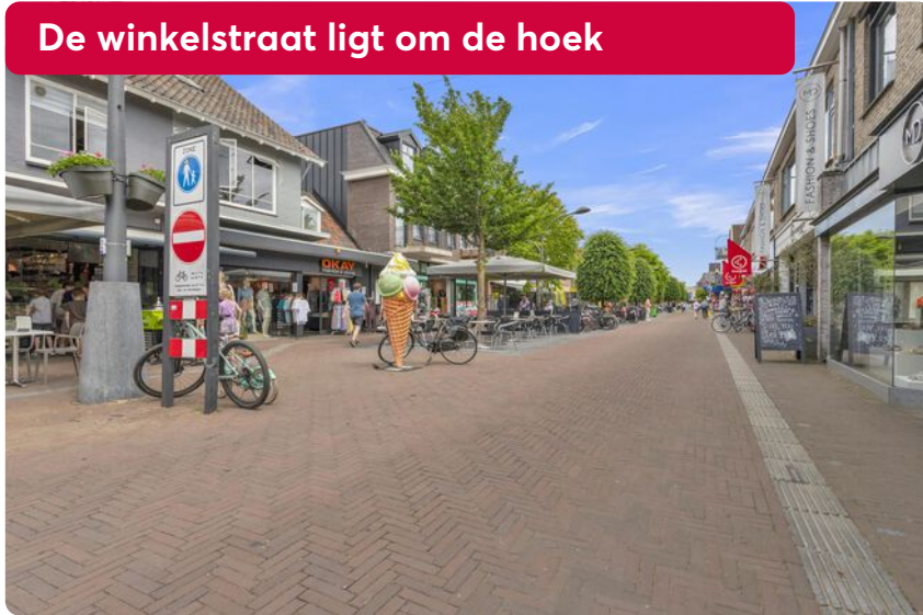
De winkelstraat ligt om de hoek