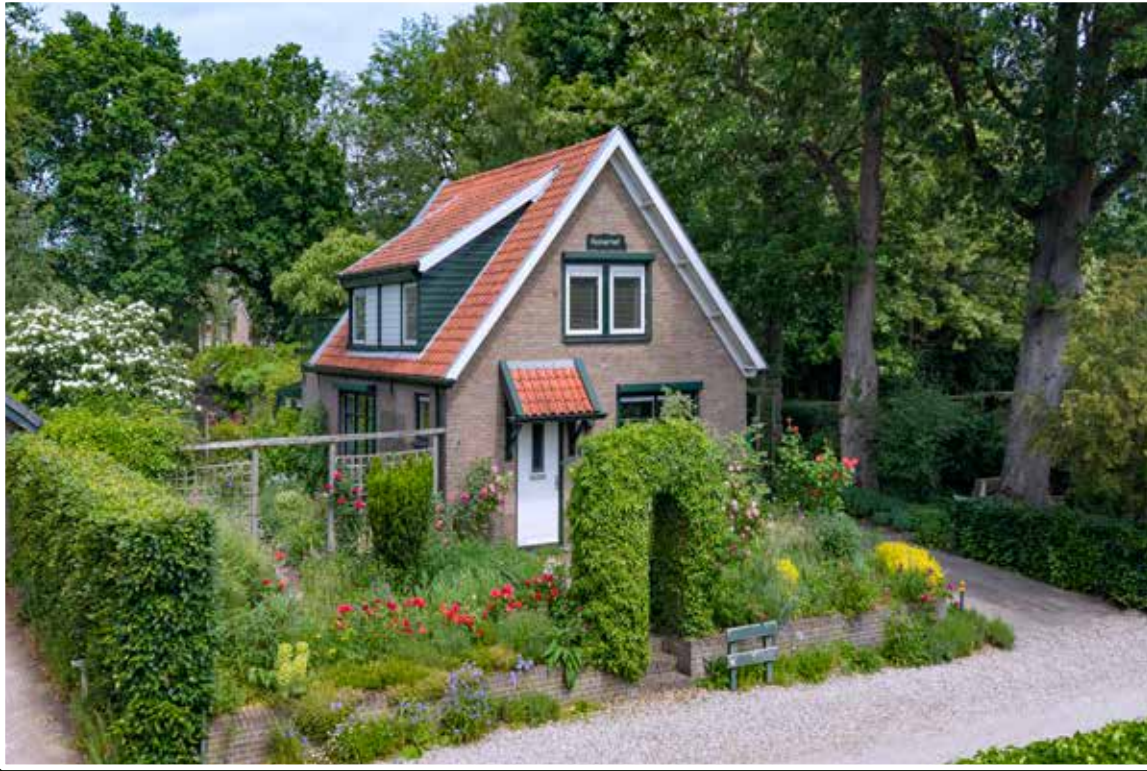
Loenen Reuweg 33